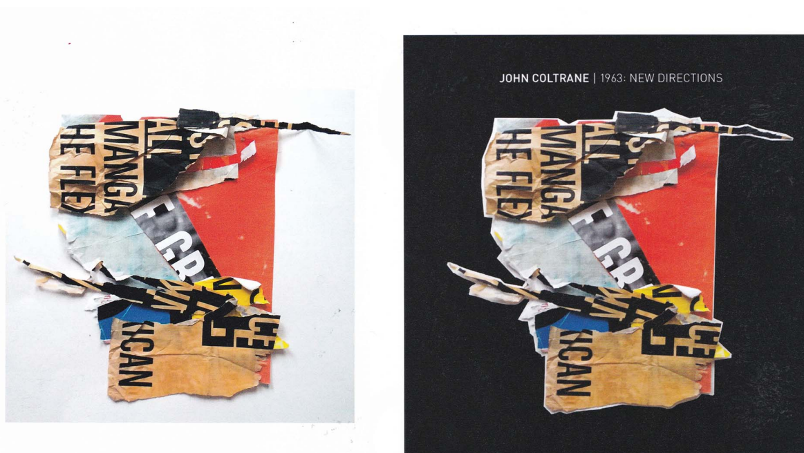
Fig. 6 : Réemploi d'un collage lors des recherches pour les pochettes d'album de John Coltrane.

D'une part, il apparaît que le graphisme d'auteur impliquerait une sorte de hiérarchie de valeurs : le recul critique, que cette pratique suppose, ferait du graphisme d'auteur une forme plus raffinée de design graphique. Dès lors, le graphisme d'auteur apporterait quelque chose de positif au design graphique, en ce qu'il aurait « enrichi, légitimé, développé et renforcé la discipline 76 ». D'autre part, il semblerait que seuls les graphistes auteurs, par des projets auto-initiés, pourraient jouir du privilège de penser un contenu et quitter le rôle de sous-traitant qui se cantonnerait à résoudre les problèmes d'un client. En somme, le peu de contraintes (ou des contraintes auto-imposées) permettrait de bénéficier d'une plus grande liberté, ce qui pourrait s'apparenter à un luxe ultime pour cette profession créative. Mais nous avons également noté que le graphisme d'auteur est avant tout une démarche et une attitude. Est-elle vraiment incompatible avec le contexte de la commande ? Au contraire, nous postulons que la pratique du graphisme d'auteur vient nourrir et enrichir la pratique du design.