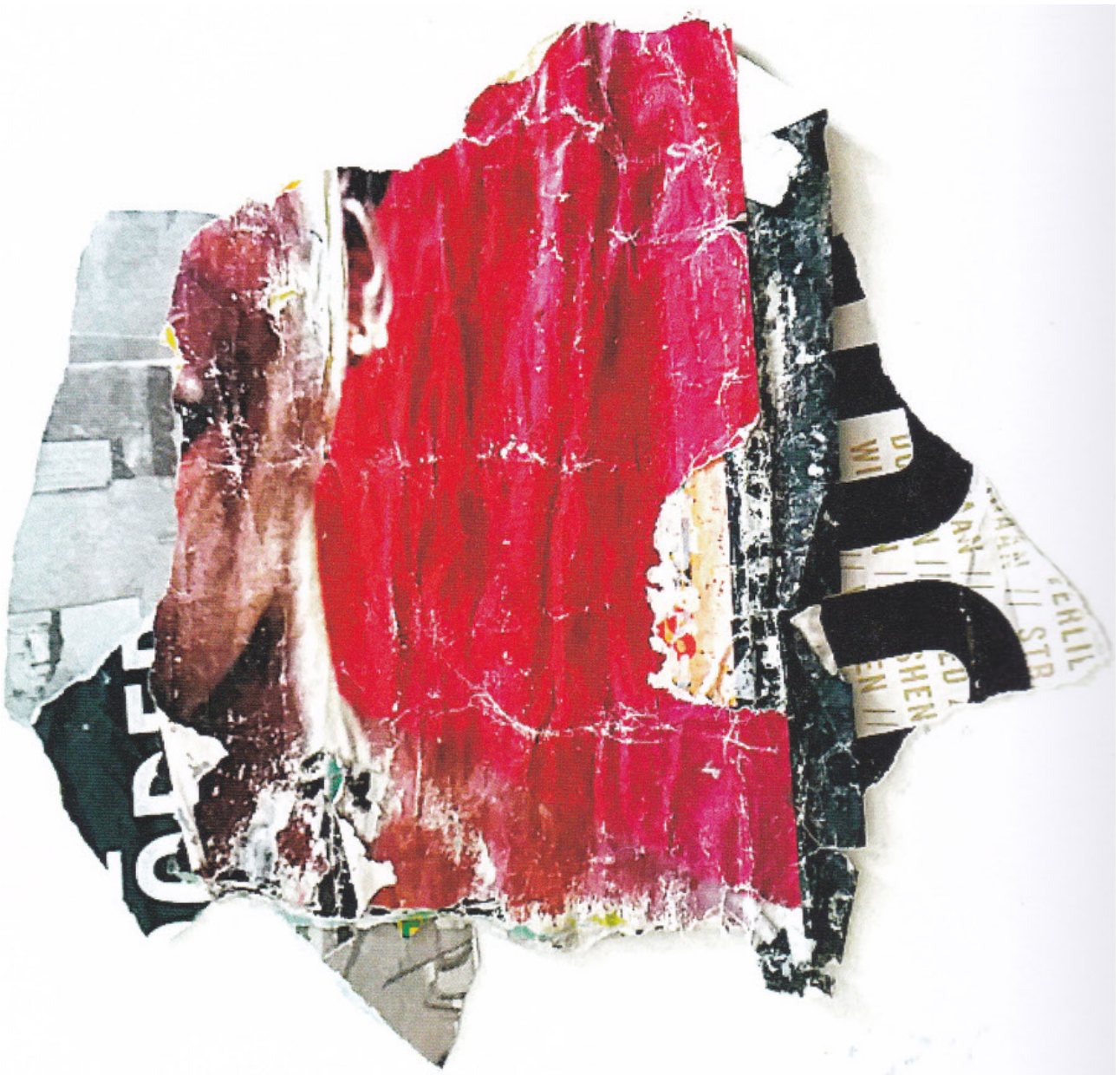
Fig. 5 : : Collage de la série « Cœurs brisés », suivant le décès de sa maman. Source : Carson, David, nu collage.001 , Burlington, Hula Publishing, 2019.