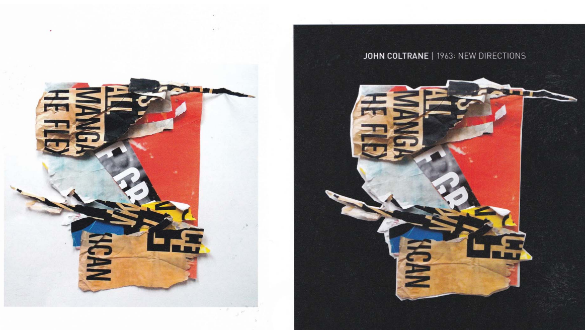
Fig. 6 : Réemploi d'un collage lors des recherches pour les pochettes d'album de John Coltrane.

D'une part, il apparaît que le graphisme d'auteur impliquerait une sorte de hiérarchie de valeurs : le recul critique, que cette pratique suppose, ferait du graphisme d'auteur une forme plus raffinée de design graphique. Dès lors, le graphisme d'auteur apporterait quelque chose de positif au design graphique, en ce qu'il aurait « enrichi, légitimé, développé et renforcé la discipline 76 ». D'autre part, il semblerait que seuls les graphistes auteurs, par des projets auto-initiés, pourraient jouir du privilège de penser un contenu et quitter le rôle de sous-traitant qui se cantonnerait à résoudre les problèmes d'un client. En somme, le peu de contraintes (ou des contraintes auto-imposées) permettrait de bénéficier d'une plus grande liberté, ce qui pourrait s'apparenter à un luxe ultime pour cette profession créative. Mais nous avons également noté que le graphisme d'auteur est avant tout une démarche et une attitude. Est-elle vraiment incompatible avec le contexte de la commande ? Au contraire, nous postulons que la pratique du graphisme d'auteur vient nourrir et enrichir la pratique du design.