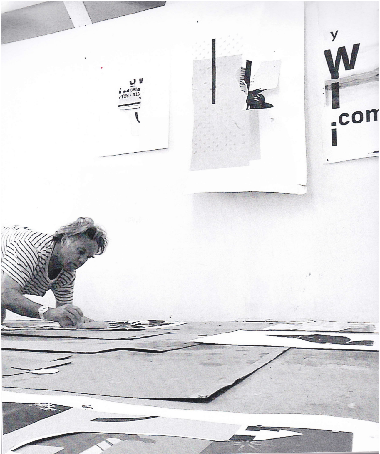
Fig. 3 : David Carson à l'œuvre. Source : Carson, David, nucollage.001 , Burlington, Hula Publishing, 2019.

David Carson revendique d'ailleurs cet état de non-aboutissement, en présentant dans nucollage.001 son travail en train de se faire. Tout d'abord, il indique clairement à la fin du livre qu'il s'agit de l'impression d'un travail en l'état, à un moment donné. Il constitue d'ailleurs la première étape d'une trilogie d'ouvrages, comme le suggère la mention « 001 » du titre. De plus, plusieurs images sont en fait des photographies du designer en train de travailler. La place accordée au « studio » est prépondérante et nombreuses sont les photographies des collages en contexte, incluant l'espace dans lequel ils ont été composés. Notons d'ailleurs que la notion de lieu organise tout l'ouvrage : chaque partie correspond à un lieu de création 43 , présenté par une