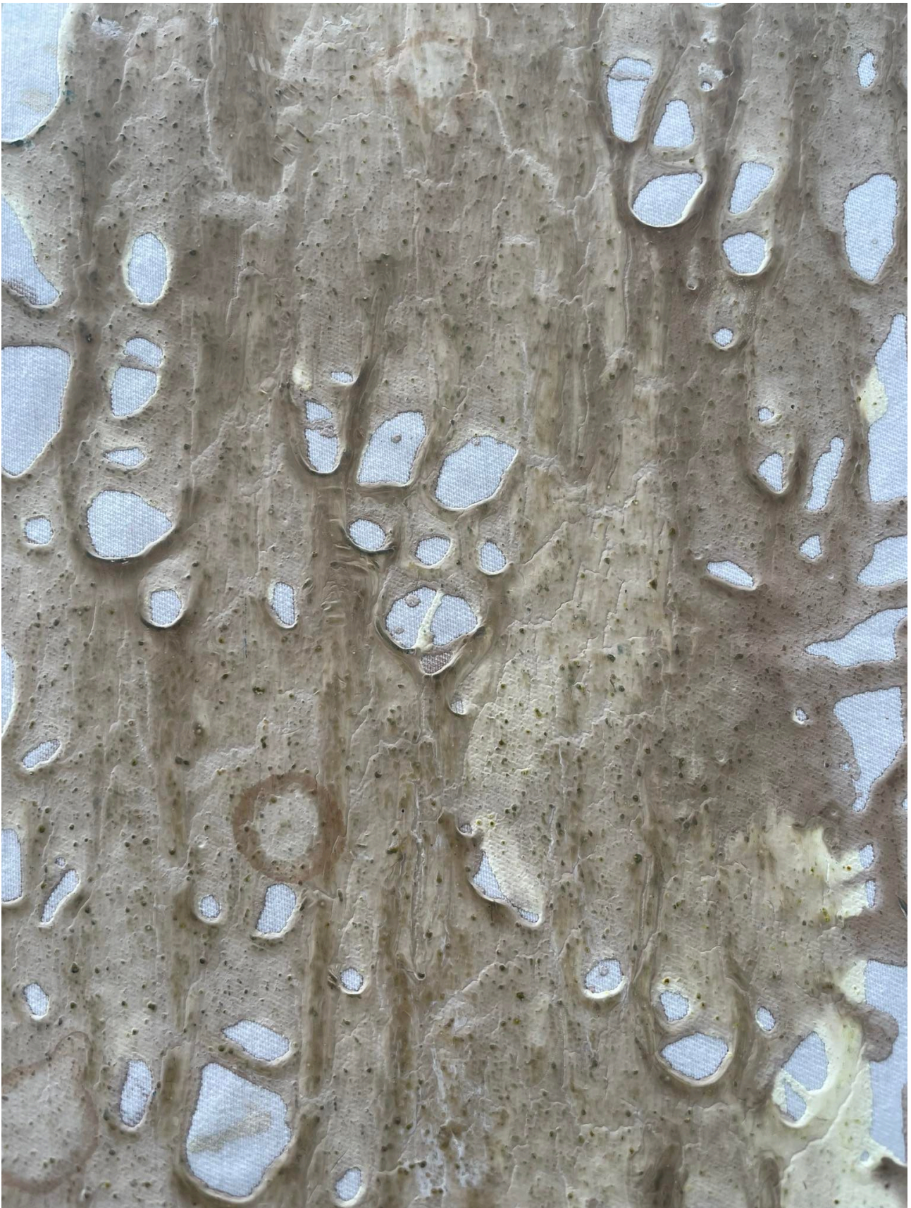
Figure 3 Collection des étoffes en effet cuir écologique 8

La métamorphose opérée n'est pas seulement chimique, mais constitue une véritable abstraction technique qui permet de faire surgir de nouvelles potentialités matérielles. Comme le souligne Bernard Stiegler, « La technique procède par abstraction constitutive, c'est-à-dire par désolidarisation des déterminations primordiales de la matière pour ouvrir des possibles inouïs ». 9