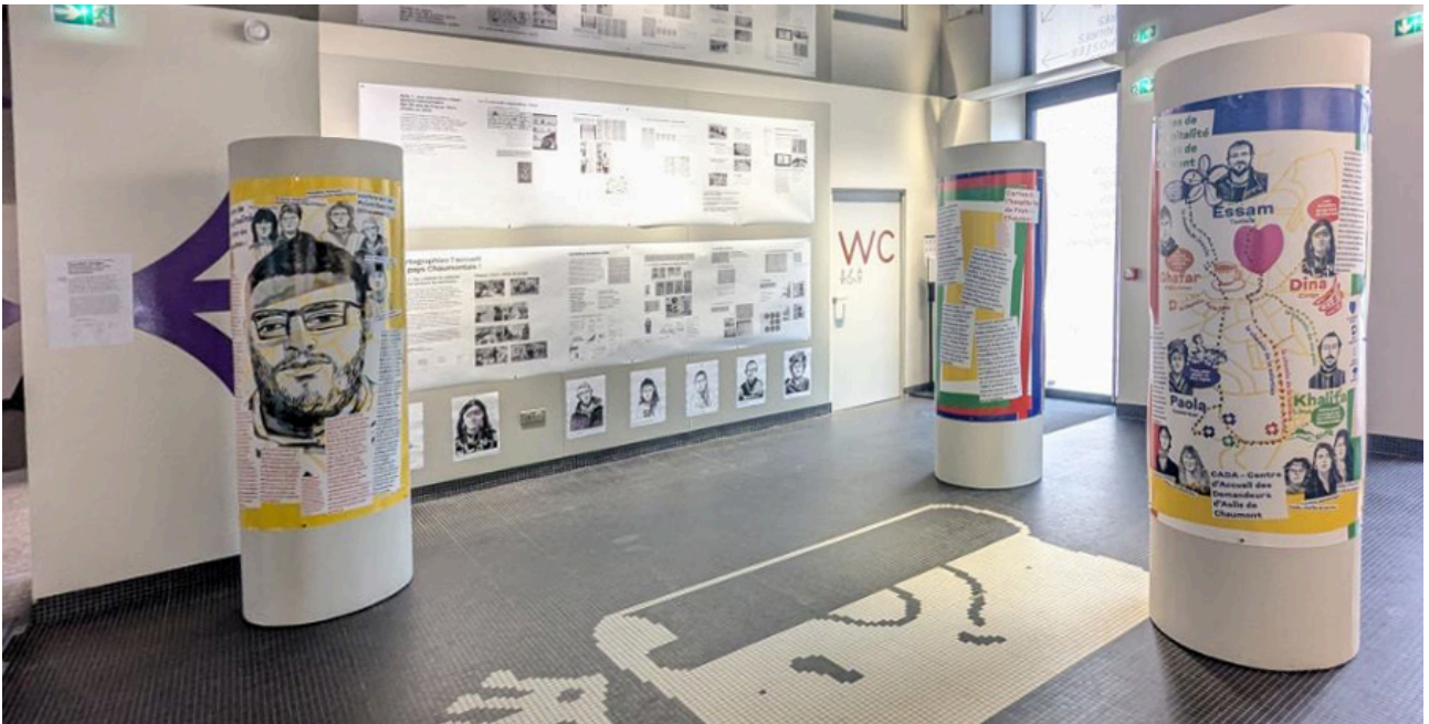
Fig. 2 - Exposition Cartographiez l'accueil du pays Chaumontais ! au Centre national du graphisme le Signe à Chaumont. Prototypes et démarche de projet.

L'objectif est de comprendre les rapports culturels à l'accueil et de mettre en discussion citoyenne la question de l'hospitalité chez les Chaumontais, ce qui apparaît comme un travail artistique, mais relève alors davantage d'un questionnement sur la documentation. Il s'agit de produire des documents qui travaillent la qualité sociale de la relation avec les personnes documentées : « Lorsqu'un portraitiste prend une demi-heure pour dessiner le visage d'une personne, il échange et discute avec cette personne. Cela va plus loin que le clic-clic froid de l'appareil photo 3 ». La cartographie est elle-même accueillante dans son dispositif de production.