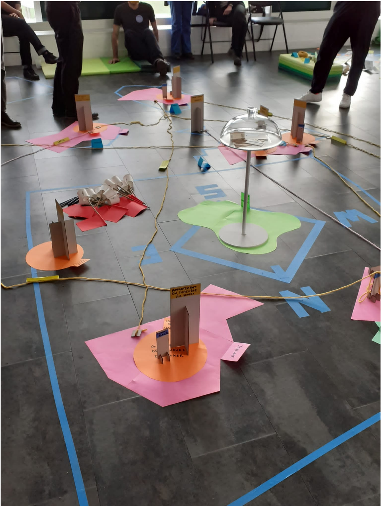
Fig. 3 - Cartographie en cours de production.

Plus qu'une production de carte à portée expressive, l'atelier convoqué ce jour à Montreuil relève davantage d'une enquête citoyenne utilisant les méthodes des sciences sociales que d'un atelier artistique. Cette journée est une partie d'un cycle d'ateliers de recherche populaire . Ces recherches visent à interroger des thématiques de société à partir d'objets apparemment anodins.