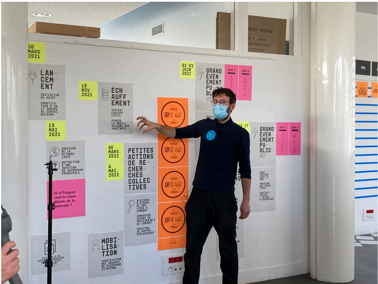
Fig. 6 - Présentation du dispositif et de la journée.