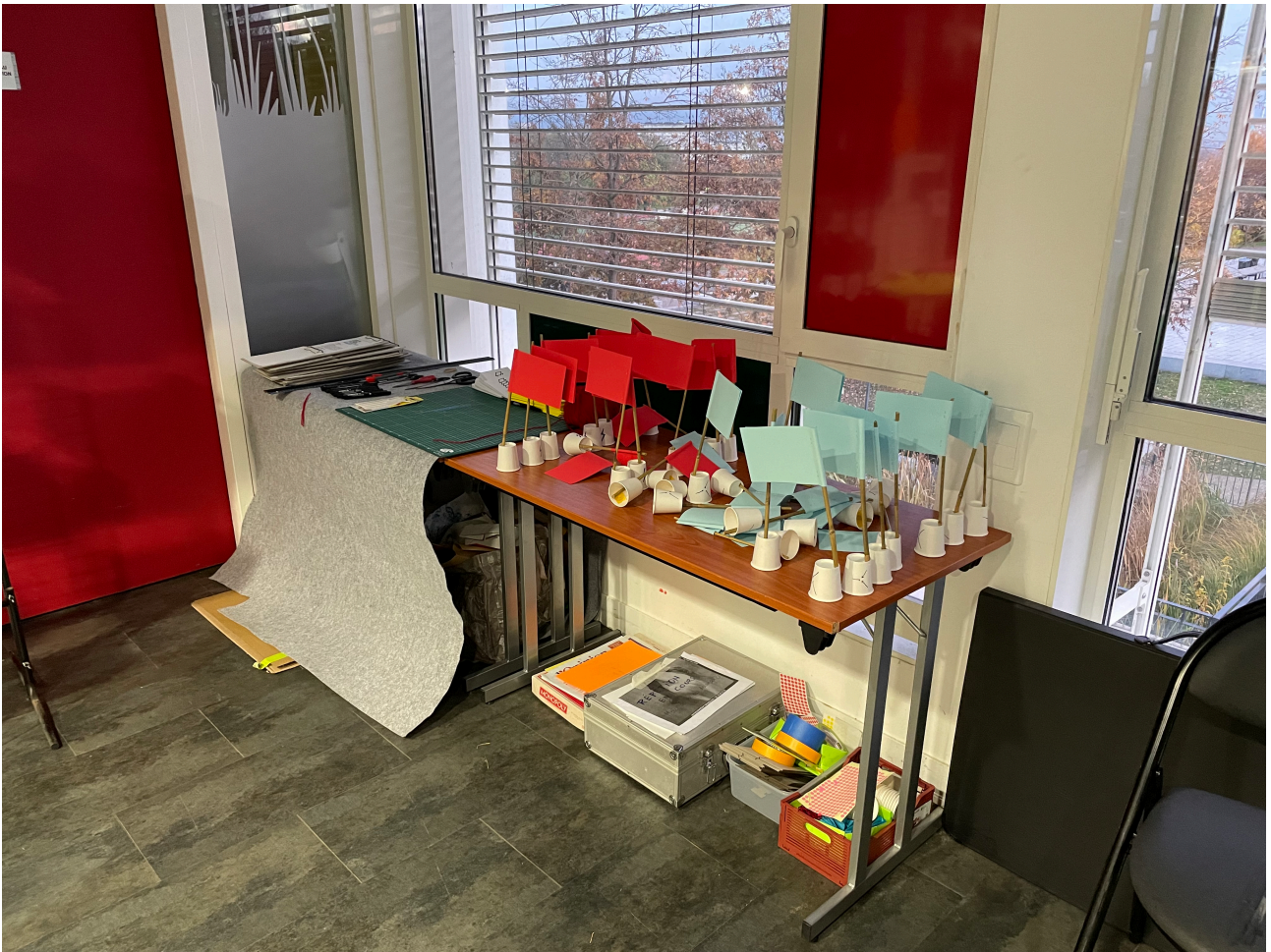
Fig. 5 - Compléments à l'armoire de formes.

L'atelier commence par une présentation générale, aussi appelée « plénière » [fig. 6]. L'animateur présente les principes généraux des mises en quarantaine citoyennes avec un calendrier d'action : contexte, principes méthodologiques puis les activités du jour. La salle est alors présentée aux participants en expliquant les différentes zones de l'atelier.