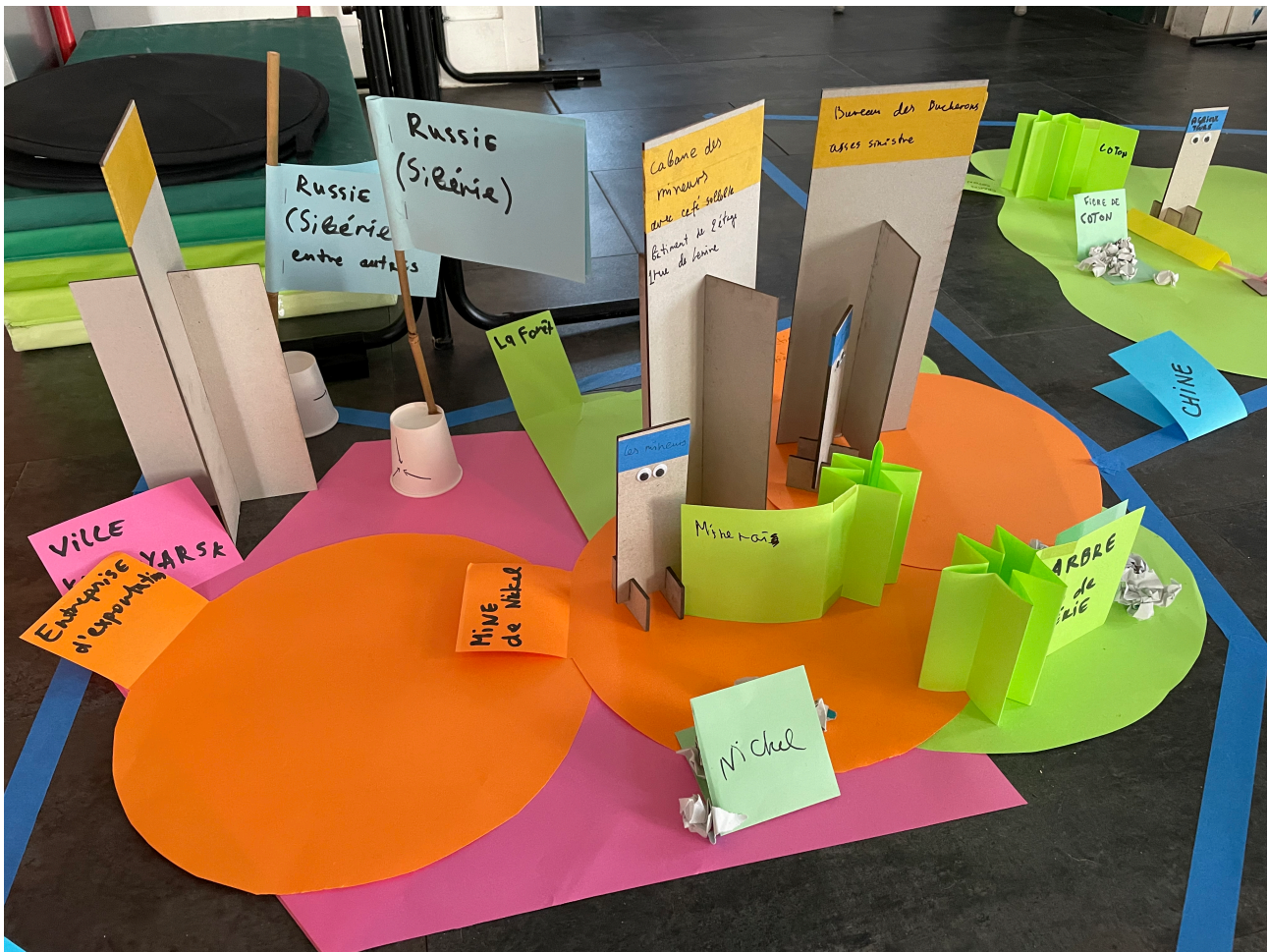
Fig. 8 - Une partie de la cartographie.

Les animations cherchent à mettre les participants en « situation d'ignorance 6 ». Il ne s'agit pas de mobiliser des expertises ou des opinions, mais une dynamique de recherche en groupe : dialoguer, ne pas convoquer les savoirs stabilisés, rechercher l'inconfort. À ce titre, l'ensemble des participants ne sont pas invités en tant qu'experts du sujet.