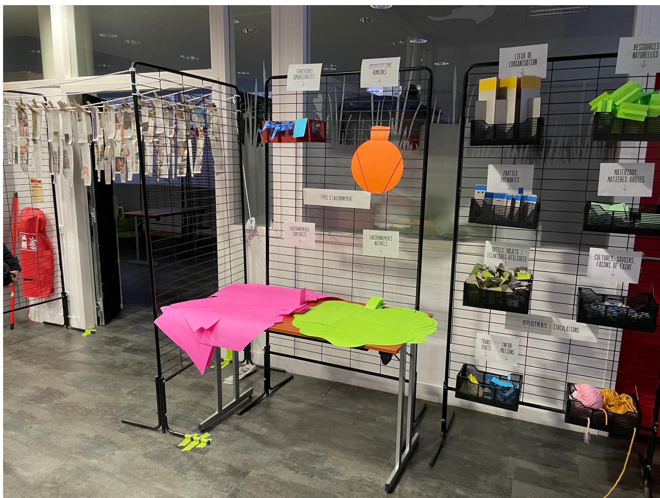
Fig. 4 - Armoire de formes.

Un scénario a été soigneusement élaboré et un espace pensé pour favoriser le travail en équipe. Une gamme de matériaux et d'outils est à disposition. L'armoire de formes [fig. 4] [fig. 5] contient des matériaux pour indiquer les 14 types d'informations attendues sur la carte : territoires administratifs, organisations humaines (entreprise, association), les lieux, parties prenantes, culture-connaissance-perception des acteurs, objets-techniques-outils, ressources naturelles, matériaux ou matières bruts, temps-durée des opérations, des tickets de recherche, déplacement-circulation, transport, nature de l'information ; enfin, une série de drapeaux permet d'indiquer les constats du groupe vis-à-vis des données. Les matériaux sont constitués de feuilles de papier, de feuilles de carton, de fils, de scotchs, de papiers froissés et de formes en volumes de couleurs différentes. Chaque matériau est déjà prédécoupé ou mis en forme afin de signifier une fonction cartographique.