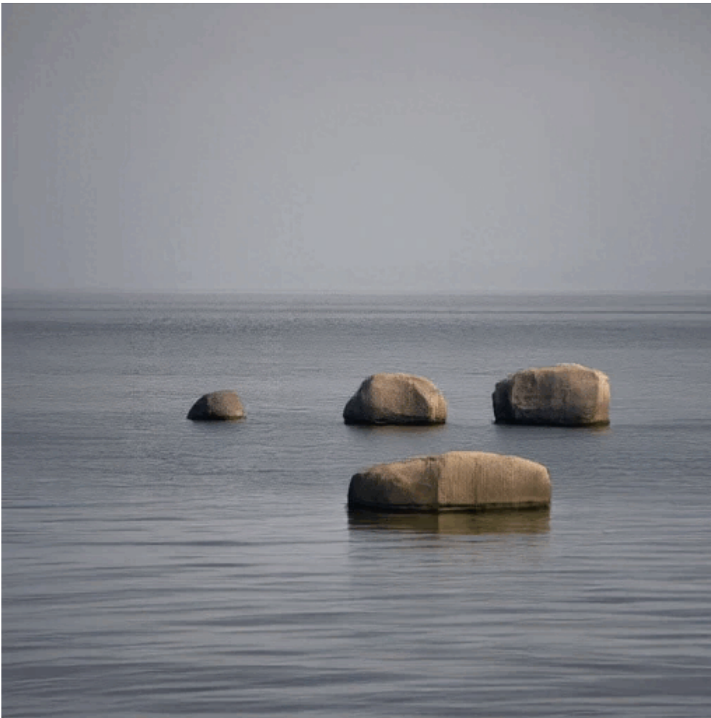
Figure 6 a et b : Pierres flottantes, Mailé Patéa, AMERS II 2025.

b. Positive : best quality, 4k, HDR, the rocks are surfing on the waves, we see them floating on the water and moving, there are lots of movements