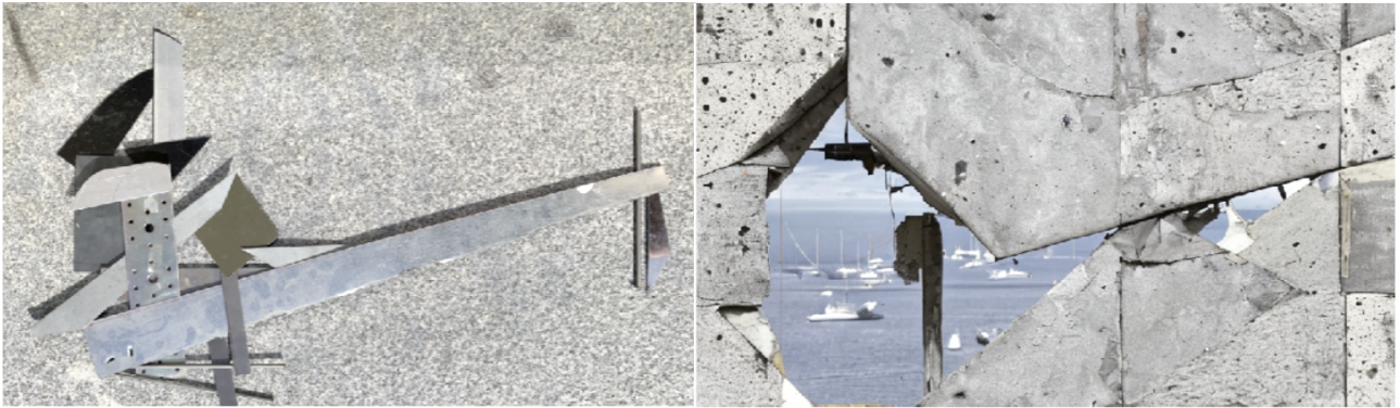
Figure 5 : Concrete, patchwork, port, sea, Jean Bossard & Marie Brin, AMERS II 2025.

Prompt a : sand, move, wind & Prompt b : universe, ocean, wave, move