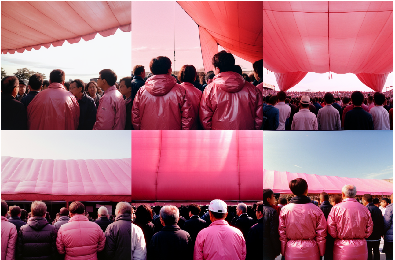
Figure 1 a et b : essais préparatoires T2I, Eglantine Bigot-Doll, Stable Diffusion, 01.2025.