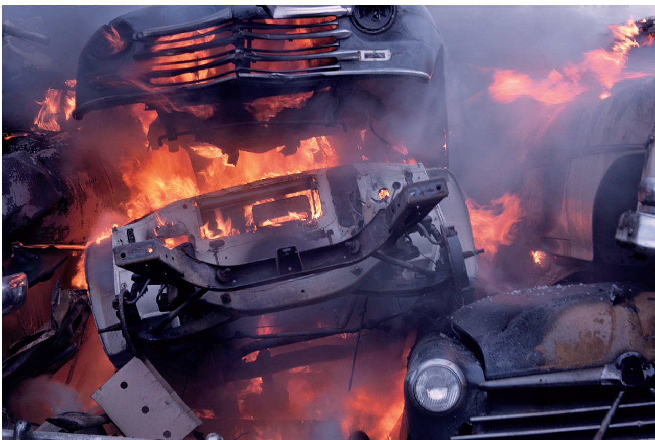
Figure 4. Requiem , 1960, Court-métrage, 10 mn, photo par George Nelson pendant le tournage du film.

contemporaine de Harold Selesky, une caméra avec un filtre rouge filme pendant dix languissantes minutes des voitures dans une casse, encadrées les unes dans les autres ; usant de longs travellings, elle s'attarde sur les détails en feu de ces montagnes orangées (Fig. 4). Critique sans appel de l'économie du styling , vantée par Reyner Banham 50 , le film en 35mm est un lent et douloureux plaidoyer contre l'industrie automobile et la consommation de signes ostentatoires qui cible très particulièrement les États-Unis du tout automobile. Pour Nelson les monticules de déchets accumulés dans la casse reflètent notre propre déphaséité. Les automobiles, corps cassés, blessés mais pas encore mortes de tout subjectivité ne sont dès lors pas dissolvables. Elles restent, envahissent l'écorce terrestre posant la question de son habitabilité.