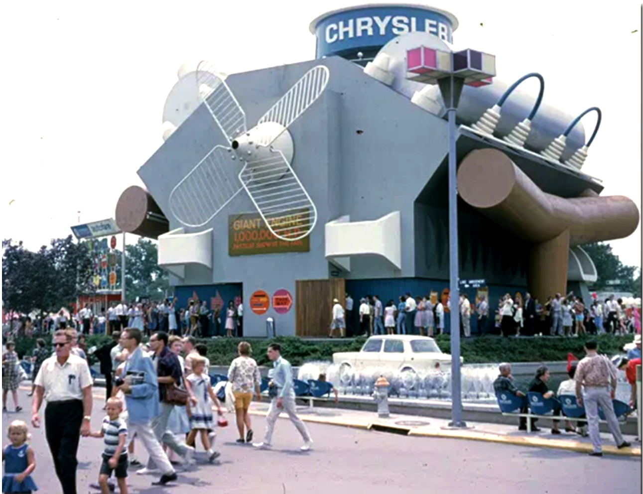
Figure 5. Chrysler Pavilion , New York World Fair, 1964, George Nelson et Irving Happer, Flushing Meadows Park.

fascination moderne, un mouvement plus général s'amorce.