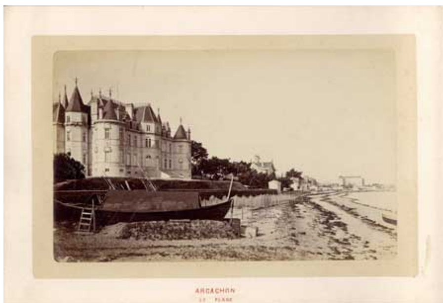
Fig.7 CP touristique, Arcachon (vers 1900)

rhétorique comme fragment de territoire. Cependant, au-delà d'une attente de vérité transcendantale , une autre attente de vérité est aussi à l'œuvre ; une attente de vérité correspondantiste de l'image, qui confère à la carte postale, en tant qu'image de reportage photographique, une valeur de témoignage. Pour le sens commun, la photographie est reçue comme un document qui donne à voir réellement le monde. En d'autres termes, c'est bien en tant qu'effet de réel que l'image photographique est lue par le spectateur. Cette attente de vérité testimoniale est en effet encore partagée par le plus grand nombre. Elle demeure – pour combien de temps encore ? – au fondement du reportage photographique, remplissant la principale fonction de l'image photographique énoncée dans l'édition journalistique et publicitaire, et ici de la carte postale.