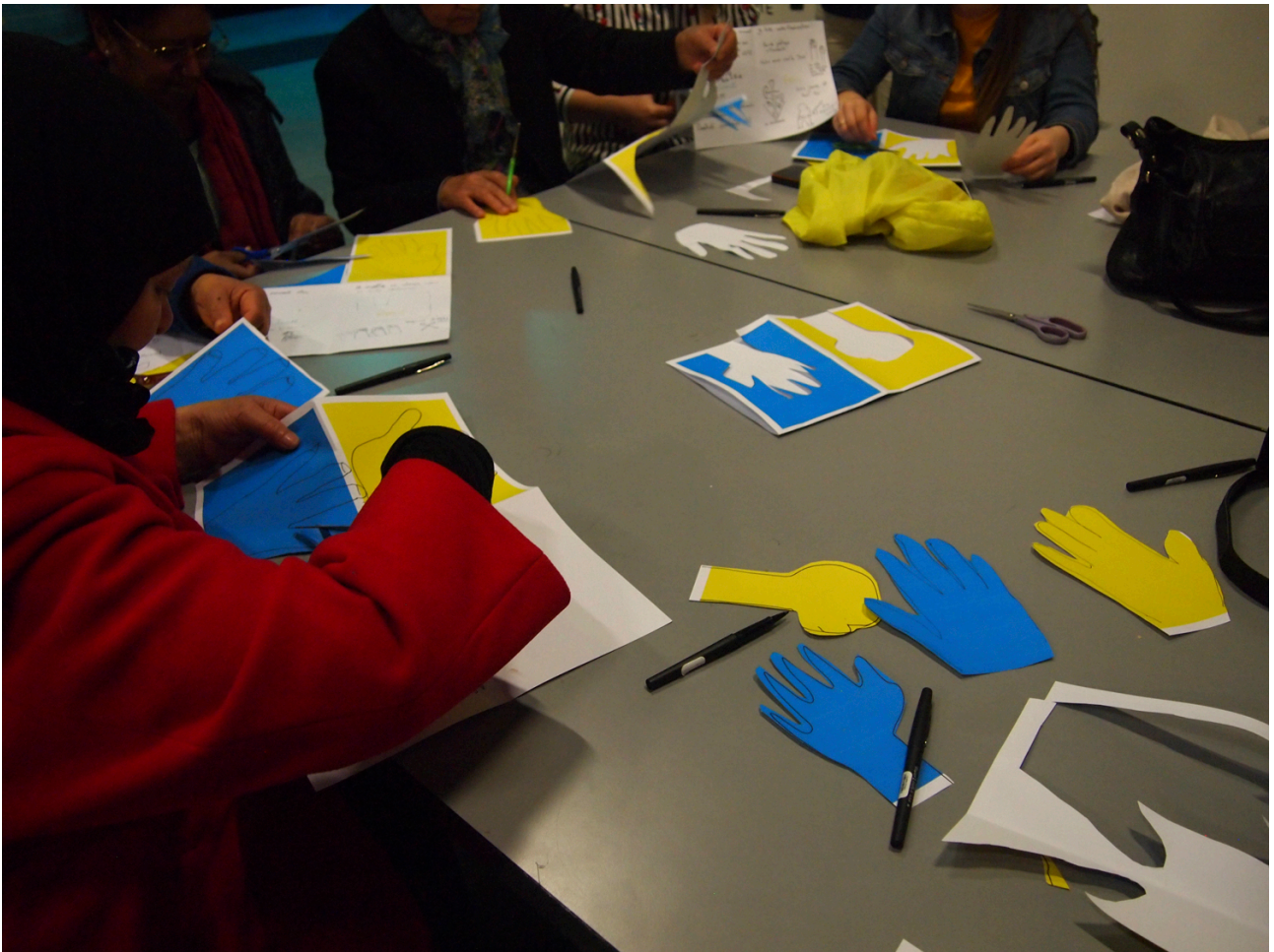
Atelier de production à partir de textes.

Ces images sont imprimées avec différents moyens suivants les lieux de production (sérigraphie, linogravure, impression numérique) :