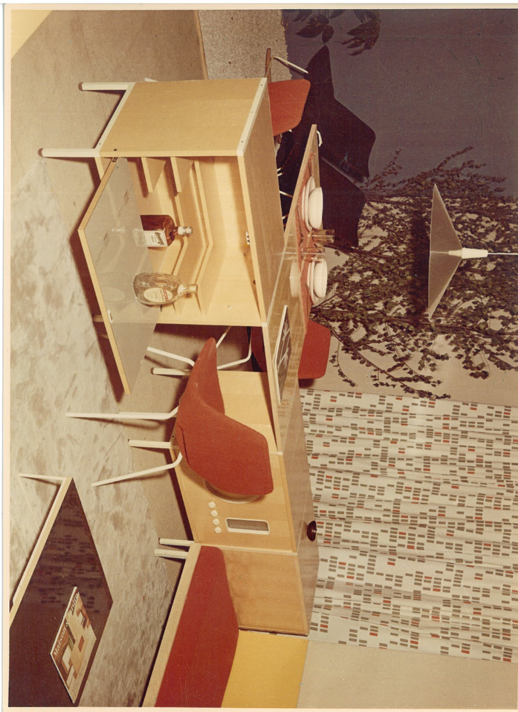
Concours Formica, conçu en 1956 par l'ARP.

La table établit un décrochement dans le plan rectangulaire composé par les caissons en bois clair de chez Minvielle. Les repas se prennent soit en tête-à-tête, soit à quatre le tout éclairé par le plafonnier 3077 de l'ARP, édité par Pierre Disderot. Des chaises rouges Amsterdam de Steiner accompagnent les fauteuils G1 de chez Airborne, dessinés par Pierre Guariche. Deux banquettes juxtaposées disposent également d'un élément qui consiste en un décor mural en Formica jaune fixé au-dessus des coussins rouges qui tranchent avec les rideaux Gratte-ciel de Jacqueline Iribe. Pour achever ce concept novateur, il dispose un fauteuil Corb A7 , face à une table de Pierre