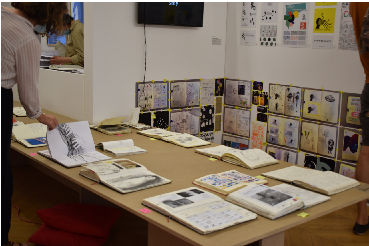
Figure 5. Vue des carnets des designers graphiques exposés dans Chair de graphisme

Ces carnets étaient exposés de manière authentique, sans chercher à s'esthétiser auprès des visiteurs : ces pages sont exposées pour témoigner d'une création vivante, de « tout ce qui grouille et s'agite, et permet, étrangement, de faire œuvre 26 », des notes prises sur le vif tout comme des recherches erratiques. Mais, si ces carnets donnent à voir les projets exposés, ne font-ils pas pourtant partie du projet de l'exposition ? Comme nous l'avons évoqué, c'était l'intention même de cette exposition de donner à voir au visiteur le processus de conception du design graphique. Il s'agit donc, par le projet, de recontextualiser l'objet exposé : l'exposition se propose d'immerger le visiteur au sein du contexte de création des objets. Cette intention est rendue visible dès l'entrée de l'exposition, où sont exposées des photographies des ateliers des designers graphiques exposés. Nous avons vu que les expôts sont généralement coupés de leur contexte de création, pour être replacés au sein du contexte de l'exposition. À l'inverse, le contexte d'exposition se veut ici être le moment où le visiteur pourra avoir pleinement accès au contexte de création des objets. Ainsi, les expôts qui présentent le projet exposé semblent tout autant faire partie du projet d'exposition. Est-il donc possible de distinguer le projet exposé, du projet d'exposition ?