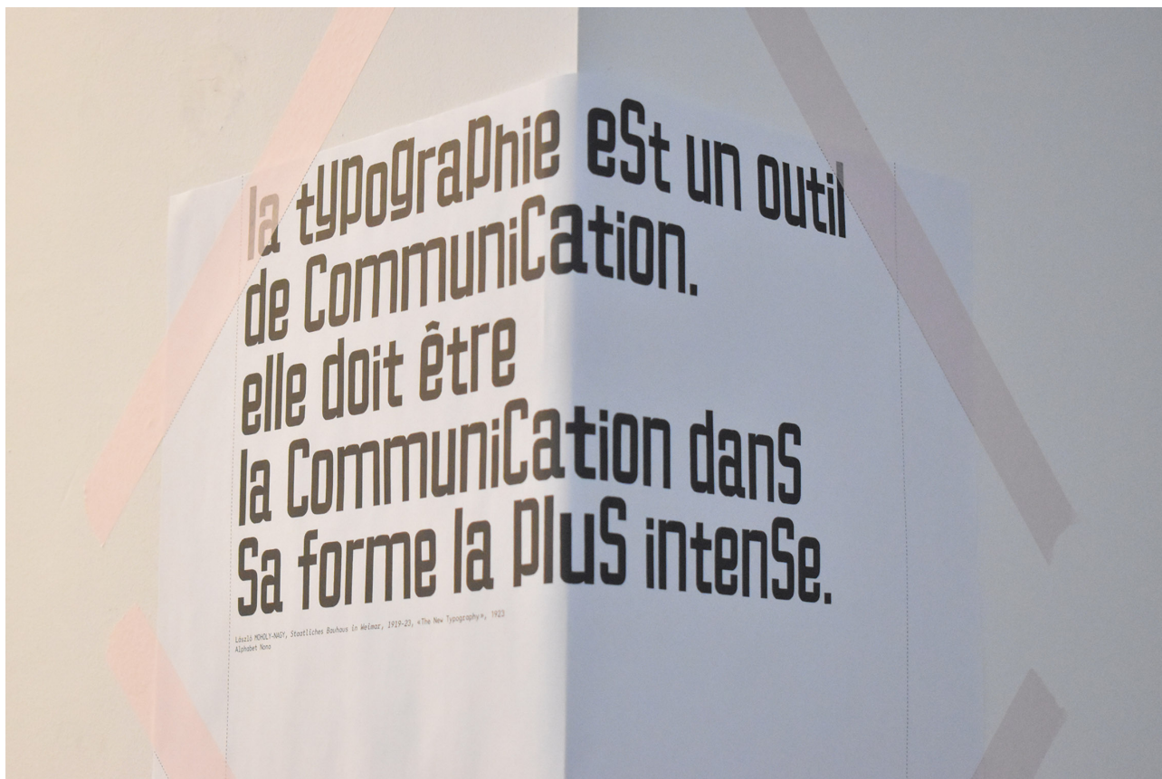
Figure 3 : Citation de László Moholy-Nagy, exposée dans Étienne au carré

Ici, les pictogrammes créés pour la signalétique du Louvre Abu Dhabi sont tout d'abord des expôts (comme l'indique le cartel), mais, en même temps, ils retrouvent leur fonction de signalétique au sein du Musée des Arts Décoratifs qui accueille l'exposition. Enfin, d'autres objets sont encore plus difficilement catégorisables. C'est par exemple le cas de citations affichées sur les cimaises de l'exposition Étienne au carré 20 .