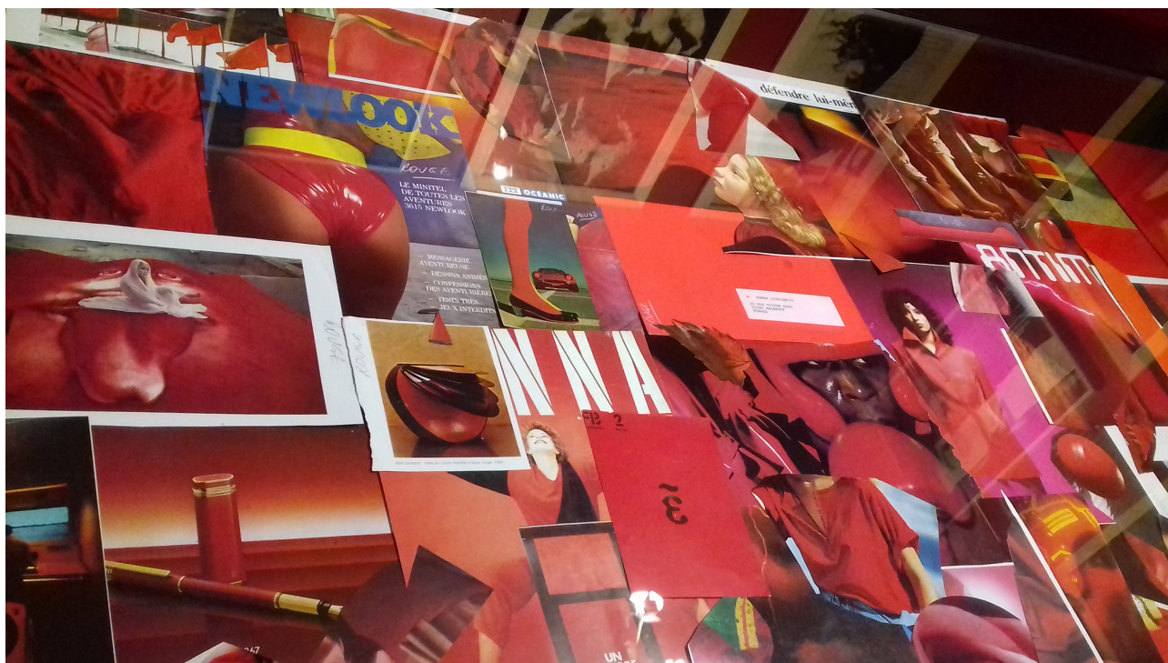
Figure 4. Boîte thématique « Rouge », exposée dans Roman Cieslewicz : la fabrique des images

Mais, d'autre part, il semblerait que l'on incite plutôt le visiteur à regarder les représentations du projet comme des expôts. En effet, on constate tout d'abord que des éléments qui permettent de retracer le processus créatif d'un designer graphique sont souvent exposés selon les mêmes modalités que les objets aboutis. À titre d'exemple, évoquons les boîtes thématiques de Roman Cieslewicz. Ce designer graphique pratiquait une collecte d'images foisonnante, qu'il découpait et classait dans des boîtes thématiques, afin de devenir le futur matériau des images qu'il créait. Lors de la rétrospective de ce designer au Musée des Arts Décoratifs, le contenu de certaines de ces boîtes était mis à plat et exposé sous des vitrines, de la même manière que des œuvres du designer graphique.