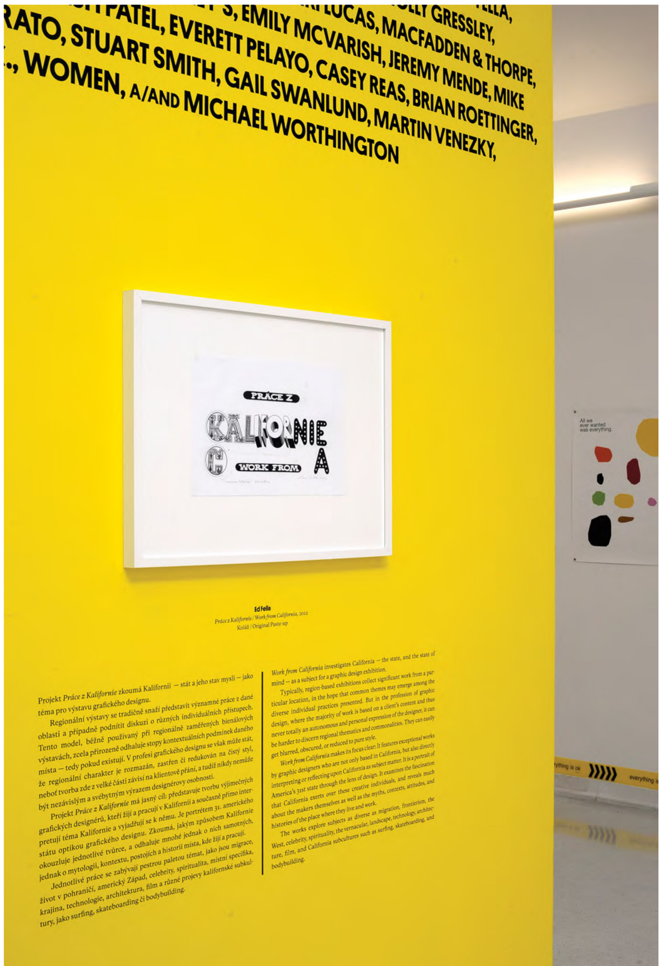
Figure 2. Vue du logo d'Ed Fella exposé dans Work from California