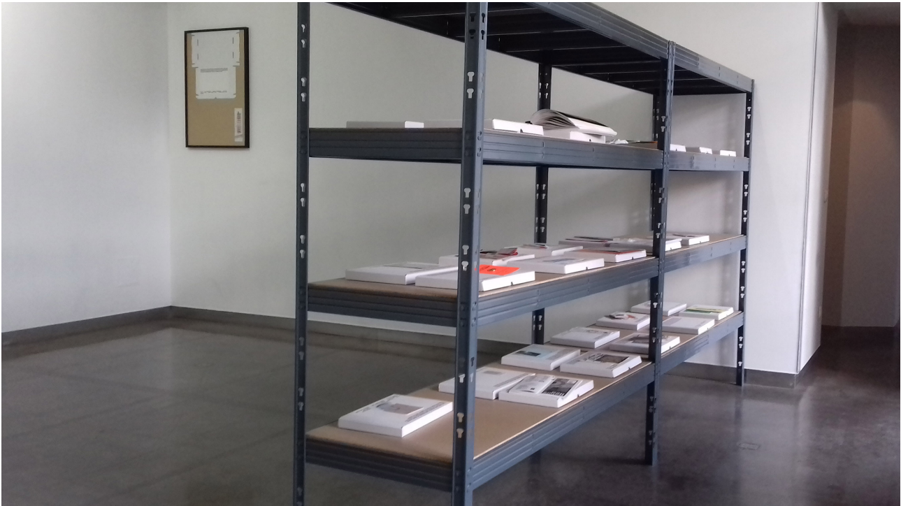
Figure 6. Vue de l'exposition Ce n'est pas la taille qui compte à la Maison d'Art Bernard Anthonioz

sur leur discipline. Depuis quelques années, ils donnent à voir ces réflexions en concevant plusieurs expositions. Pour l'exposition à la Maison d'Art Bernard Anthonioz, leur point de départ est la constitution d'un « Fonds International d'Objets Imprimés de Petite Taille ». Alors qu'une exposition de design graphique s'articule en général autour du travail d'un designer, d'une période historique, ou d'un procédé technique, ici, on note une « absence d'évidence qui la motive 36 ». De fait, les expôts sont moins les objets graphiques eux-mêmes, que le projet qui est à l'initiative de l'exposition : la constitution d'archives graphiques. C'est ce projet de constitution d'un Fonds International d'Objets Imprimés de Petite Taille qui est ici exposé, et donné à voir aux visiteurs. D'ailleurs, le dispositif scénographique accompagne cette notion d'archivage : de grandes étagères métalliques, sur lesquelles sont rangées des boîtes étiquetées et nomenclaturées, où reposent les objets.