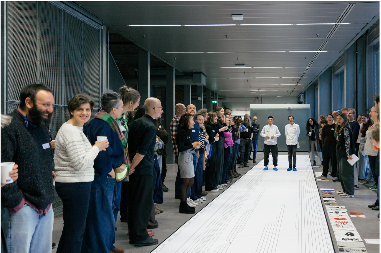
Figure 1. Vue d'ensemble au début du workshop

Le workshop a commencé par une déambulation (littérale) le long de cette histoire de 25 mètres/80 ans, pendant laquelle nous avons présenté ce qui a été documenté de l'histoire de notre institut à nos collègues, tous ayant des relations et connaissances de l'histoire de notre Academy très différentes, le but étant de leur donner un point de départ et de référence. Après environ une demi-heure de marche lente, les quelques 150 membres de l'Academy présents furent invités à se positionner sur la frise au moment précis où leur relation avec l'institut commença (qu'importe qu'ils fussent étudiants, employés, freelance, ou autre). Cela permit une première mise en perspective avec les plus anciens venant des années 1980, les plus récents étant là depuis moins d'un an, et avec des âges qui ne s'alignèrent pas avec la linéarité de la frise : certains des employés les plus âgés étant ceux qui ont rejoint l'académie le plus récemment. Sur la base de cette répartition, 3 groupes générationnels avec un nombre de participants similaire furent créés : les 1980-2001, les 2002-2015, les 2016-2024.