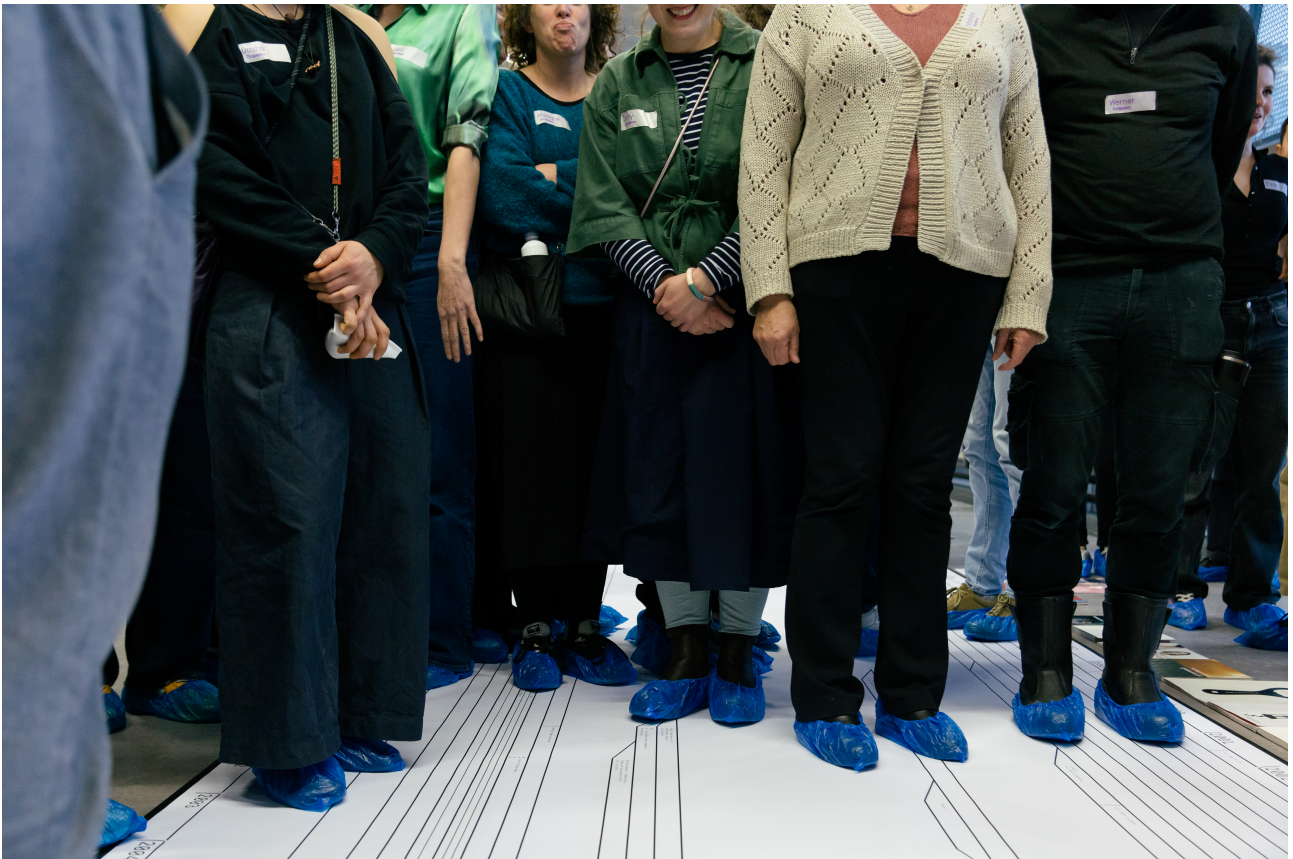
Figure 2. Nos collègues commençant à se placer sur la frise année après année

Nous les avons ensuite invités à former des groupes intergénérationnels au sein desquels ils ont dû ajouter, corriger, annoter, les manques et inexactitudes de cette histoire documentée, mais aussi les projets futurs des années à venir et leurs contributions à cet « à venir 7 ». Cela a permis à ces différentes générations de commencer à échanger et questionner l'histoire de l'Academy, de se positionner vis-à-vis des récits existants, mais aussi à rompre certaines frontières administratives et hiérarchiques : les responsables d'ateliers, de départements, les managers, les enseignants freelance, le personnel des ressources humaines et des finances, et les concierges se sont retrouvés mélangés et ont commencé à échanger avec des collègues qu'ils rencontraient parfois pour la première fois.