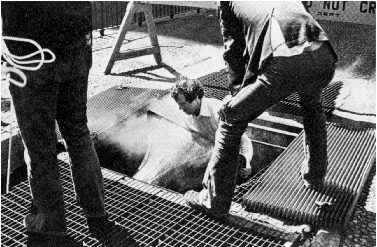
Max Neuhaus, installation Times Square , 1977