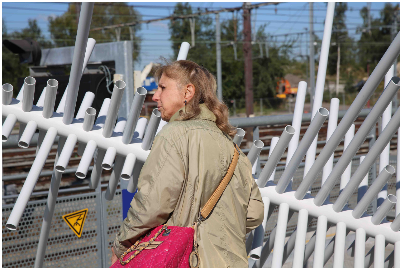
VOID Automatic Soundscape, City Sonic 2015, gare SNCB, Mons