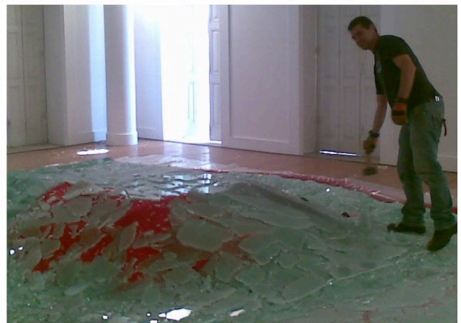
Figure 4. Extrait de l'exposition Design maço (2012) conçue par Paolo Deganello.

Exemple de conception sans utilisation et consommation de nouvelles ressources. Les photos montrent de quelle façon le verre (déchet d'autres installations) est brisé directement sur place pour servir de base aux chaises exposées. À la fin de l'exposition, tous les matériaux sont retournés aux entreprises qui recyclent les matériaux utilisés.