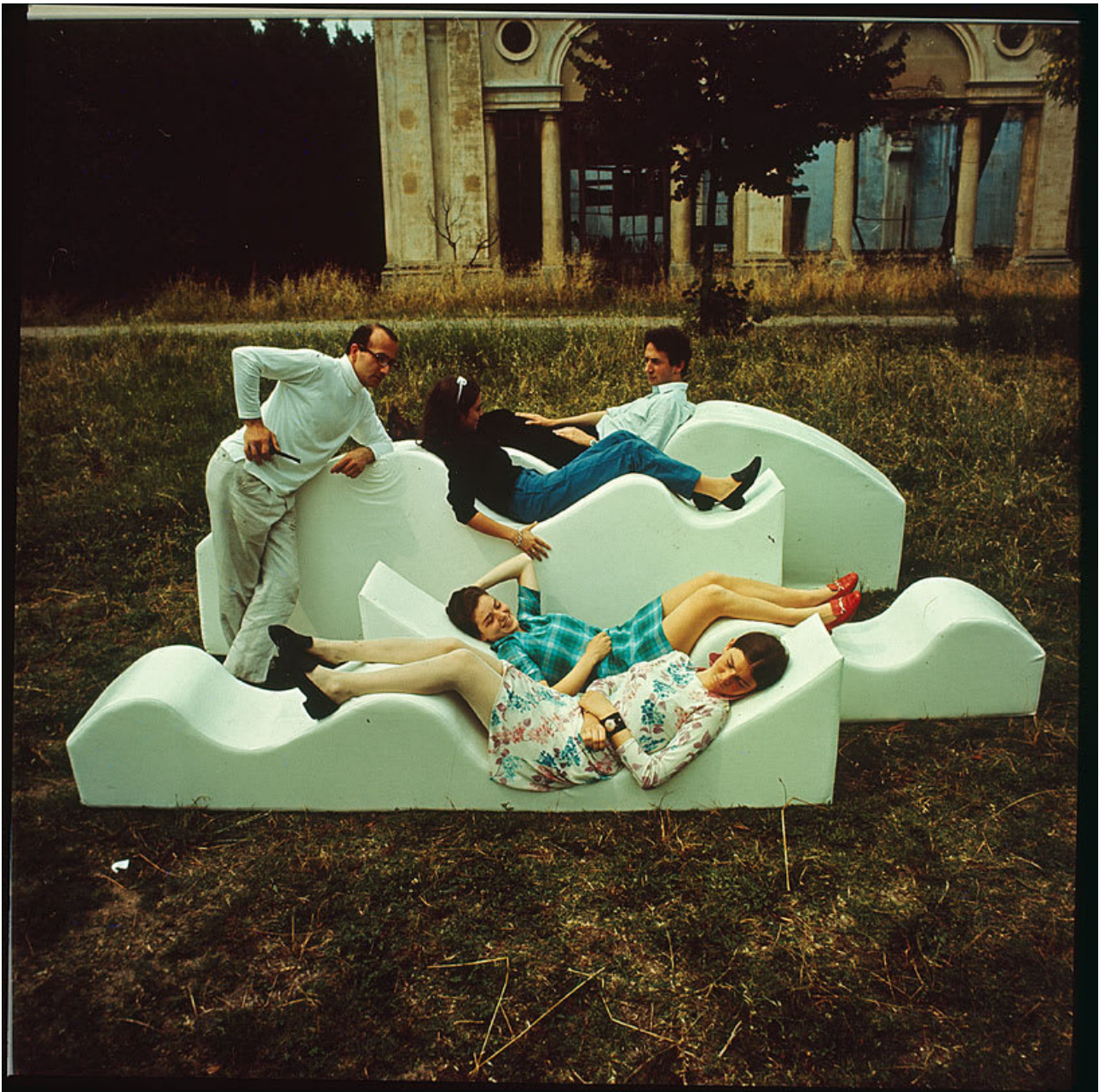
Figure 3. Superonda , Archizoom, 1966.

Aujourd'hui la massification de l'esthétique est un processus achevé, l'écologie quant à elle a une nouvelle tâche fondamentale contribuant à l'élaboration d'un nouveau projet critique consistant en la conversion écologique des biens. C'est cela le projet critique nécessaire aujourd'hui : démontrer la beauté et la supériorité des biens écologiques, en gardant bien à l'esprit que l'écologie ne doit pas faire partie de la restauration du luxe et du privilège, mais d'une diffusion structurale de la conception écologique et esthétique à l'échelle de tous les biens. De cette façon, le design peut répondre aux nouveaux rebelles qui crient : « rendez-nous l'avenir que vous nous avez volé ».