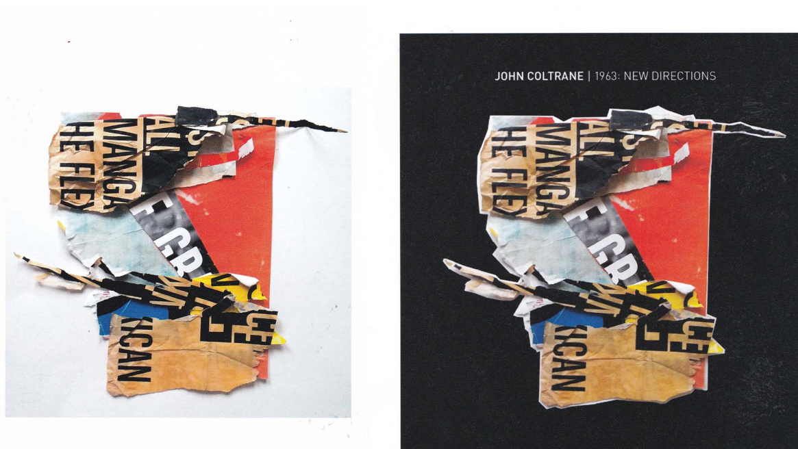
Fig. 6 : Réemploi d'un collage lors des recherches pour les pochettes d'album de John Coltrane. Source : Carson, David, nucollage.001 , Burlington, Hula Publishing, 2019.

D'une part, il apparaît que le graphisme d'auteur impliquerait une sorte de hiérarchie de valeurs : le recul critique, que cette pratique suppose, ferait du graphisme d'auteur une forme plus raffinée de design graphique. Dès lors, le graphisme d'auteur apporterait quelque chose de positif au design graphique, en ce qu'il aurait « enrichi, légitimé, développé et renforcé la discipline 76 ». D'autre part, il semblerait que seuls les graphistes auteurs, par des projets auto-initiés, pourraient jouir du privilège de penser un contenu et quitter le rôle de sous-traitant qui se cantonnerait à résoudre les problèmes d'un client. En somme, le peu de contraintes (ou des contraintes auto-imposées) permettrait de bénéficier d'une plus grande liberté, ce qui pourrait s'apparenter à un luxe ultime pour cette profession créative. Mais nous avons également noté que le graphisme d'auteur est avant tout une démarche et une attitude. Est-elle vraiment incompatible avec le contexte de la commande ? Au contraire, nous postulons que la pratique du graphisme d'auteur vient nourrir et enrichir la pratique du design.