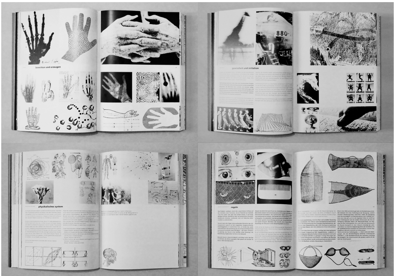
Figure 3. Quatre double-pages extraites de Erni, Peter ; Huwiler, Martin ; Marchand, Christophe, Transfer: Erkenne Und Bewirken , Zurich, Lars Müller Publishers, 1999.

Les professionnels du design, toutes disciplines confondues – architectes, concepteurs de produits et graphistes – avouent avoir certaines difficultés en commun : transformer leurs connaissances et leur compréhension des paramètres écologiques, économiques, technologiques et esthétiques d'un design contemporain durable dans la pratique de leur profession. Ce sentiment est partagé par les décideurs du secteur de la construction et d'autres industries. Les auteurs de Transfer présentent une collection d'illustrations documentaires et de citations dont la composition et la structure sont à la fois rigoureuses et stimulantes. Ils ont conçu une méthode qui permet de rendre les facteurs critiques de la conception de manière vivante et utilisable dans la pratique. transfer = convey : Transférer signifie faire passer, transmettre. Ce livre offre à son public quelques approches d'une « grammaire de l'écologie », se concevant comme moyen pour atteindre une fin 50 .