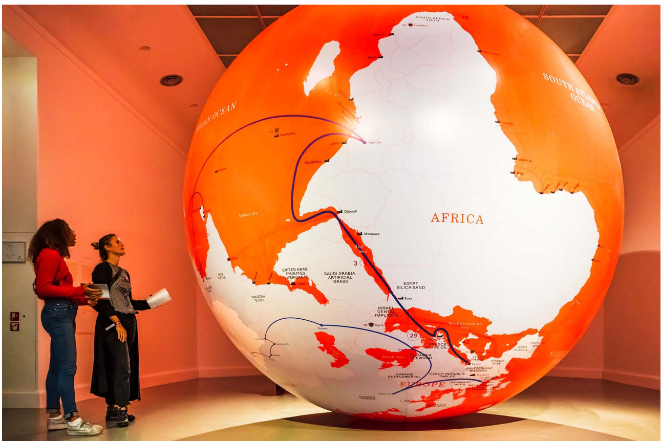
Figure 3. Stracuzzi, Irene, Custom Printing 4-meters Inflatable Globe [en ligne] TrendNomad.com.