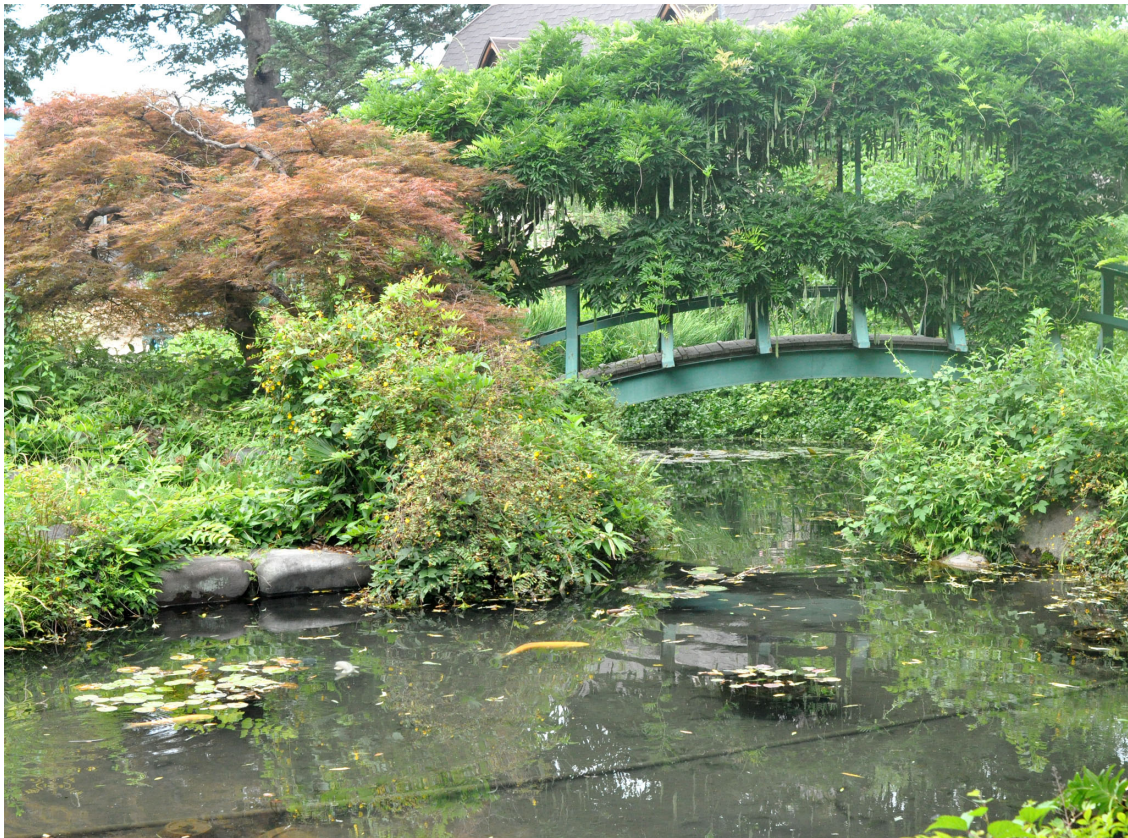
Figure1. Le jardin français du musée de la Chanson à Shibukawa, automne 2012, © Frédéric Weigel

Si les jeux de médiations symboliques nous apparaissent parfois sous la forme de paradoxes, le jardin français du Musée de la chanson à Shibukawa 5 nous semble particulièrement puissant. Celui-ci est inspiré directement des peintures impressionnistes de Monet. En son centre se trouve un petit lac rempli de carpes et de nénuphars que l'on traverse avec un pont arrondi en bois. Ce jardin français est donc une réplique miniature du jardin de Giverny qui est qualifié là-bas de jardin japonais. Malgré l'évidence des contresens que charrie cet exemple, il n'en reste pas moins révélateur de ce qui peut arriver à celui qui spéculé un milieu éloigné au travers des représentations.