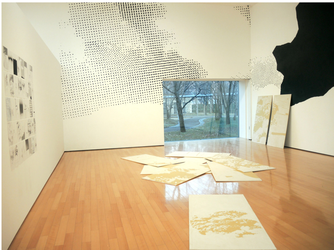
Figure 3. Maureen Colomar, exposition « Dialogue », musée de Tatebayashi, 2014