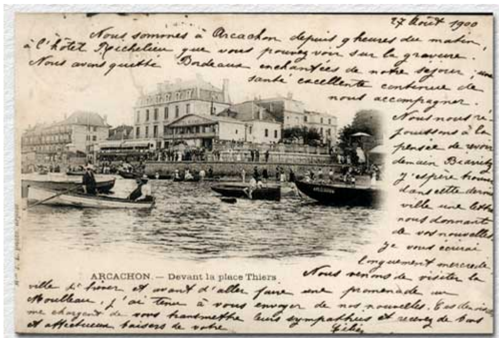
Fig.8 CP touristique, Arcachon, « Devant la place Thiers », envoyée en 1900 en 1900