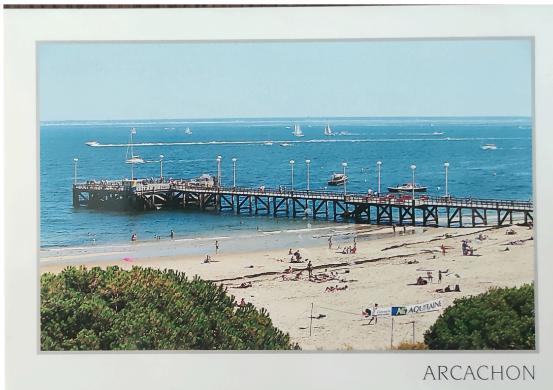
Fig.9 CP touristique Arcachon, La jetée Thiers, 2010e Thiers, 2010

Le phénomène photographique dans la deuxième moitié du XIX ème siècle réinvente notre rapport au proche et au lointain. Il propose alors – comme le fait à son tour aujourd'hui le numérique – un nouveau régime de représentation, mais aussi un nouveau régime perceptif. La construction du point de vue photographique paysager n'est en effet pas identique à la construction du point de vue pictural paysager inventée au Quattrocento. Elle renouvelle la construction spatiale qui organise les figures dans l'espace de représentation. C'est donc à travers une spatialité nouvelle, au moins en termes de représentation, que le cadre territorial paysager va se déployer. La photographie de carte postale, en popularisant la configuration symbolique paysagère – connue jusqu'ici des seules classes privilégiées à travers le paysage pictural et littéraire construit par la perspective – participe à une construction renouvelée du paysage.