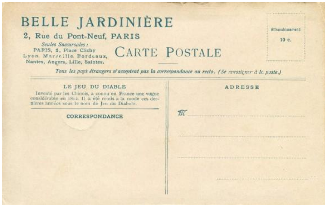
Fig.1 1875, Recto de Carte Postale, édition La belle jardinière / réédition La belle jardinière