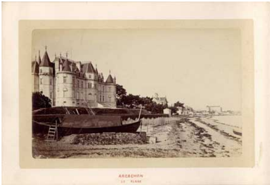
Fig.7 CP touristique, Arcachon (vers 1900)

rhétorique comme fragment de territoire. Cependant, au-delà d'une attente de vérité transcendantale , une autre attente de vérité est aussi à l'œuvre ; une attente de vérité correspondantiste de l'image, qui confère à la carte postale, en tant qu'image de reportage photographique, une valeur de témoignage. Pour le sens commun, la photographie est reçue comme un document qui donne à voir réellement le monde. En d'autres termes, c'est bien en tant qu'effet de réel que l'image photographique est lue par le spectateur. Cette attente de vérité testimoniale est en effet encore partagée par le plus grand nombre. Elle demeure – pour combien de temps encore ? – au fondement du reportage photographique, remplissant la principale fonction de l'image photographique énoncée dans l'édition journalistique et publicitaire, et ici de la carte postale.