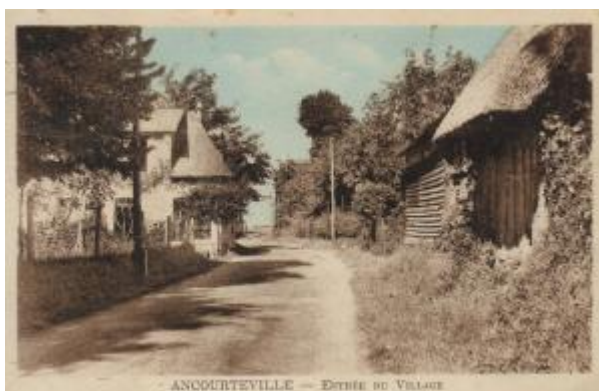
Fig. 2 Carte postale imprimée en héliogravure, (Vers 1910), Ancourteville, entrée du village en héliogravure, (Vers 1910), Ancourteville, entrée du village / héliogravure, (Vers 1910), Ancourteville, entrée du village

La CP illustrée est composée d'un recto réservé à l'écrit et d'un verso réservé à l'image. En 1873, les règles de l'administration des postes 10 imposent qu'au recto (fig.1) ne figure aucune illustration, car il est destiné à recevoir uniquement l'adresse du destinataire. Au recto, doit être uniquement mentionné les éléments suivants : la formule « Carte Postale », et trois ou quatre lignes horizontales imprimées sur toute la largeur de la carte, réservées à l'adresse du destinataire. Après la réforme de 1903 11 , le recto devient verso et inversement le verso devient le côté où se présente l'image. Après la réforme de 1903, le recto devient le côté de l'adresse et du message et l'emplacement du timbre. Le verso devient le côté réservé à la seule illustration. Cependant, pour maintenir le principe du message au dos de la carte, donc au verso, le recto devient verso. Sur le verso est donc inscrit le message, auquel on ajoute l'adresse et le timbre. Le côté vue devient donc le recto 12 .