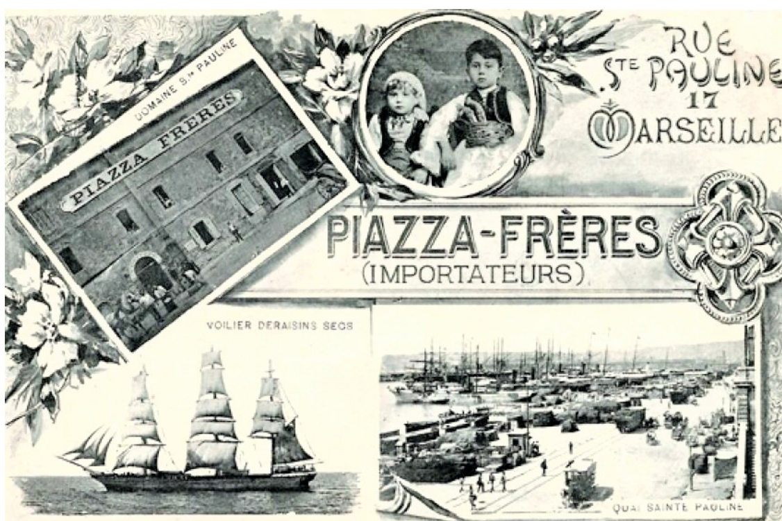
Fig.4 Vers 1896-98, Carte Postale photographique éditée par Dominique Piazza à Marseille éditée par Dominique Piazza à Marseille éditée par Dominique Piazza à Marseille

Au-delà de toutes les polémiques entretenues notamment par de très influentes sociétés de cartophiles, tout le monde est d'accord pour affirmer aujourd'hui que c'est l'Exposition Universelle organisée à Paris en 1889, qui rendit populaire en France l' image-objet de carte postale illustrée par une gravure exécutée par Léon-Charles Libonis (fig. 3). Rappelons, que sous l'impulsion de la Société d'Exploitation de la Tour, associée au journal Le Figaro, des gravures de l'artiste Libonis représentant la tour Eiffel furent imprimées en cartes postales à environ 300 000 exemplaires. Le journal 20 relate que « le public enthousiaste » se précipita pour acheter un « souvenir » de l'événement, sous la forme d'une « carte à envoyer » à leurs clients, amis ou parents. On peut alors décrire cette carte postale devenue mythique comme suit : Au verso de la carte illustrée, on peut donc voir une gravure de Libonis, avec dans la partie gauche la mention « Libonis au soleil » occupant le tiers de la surface. Au recto, réservé à l'adresse du destinataire, se trouvent deux timbres à date : celui de l'Exposition Universelle et celui de la tour Eiffel.