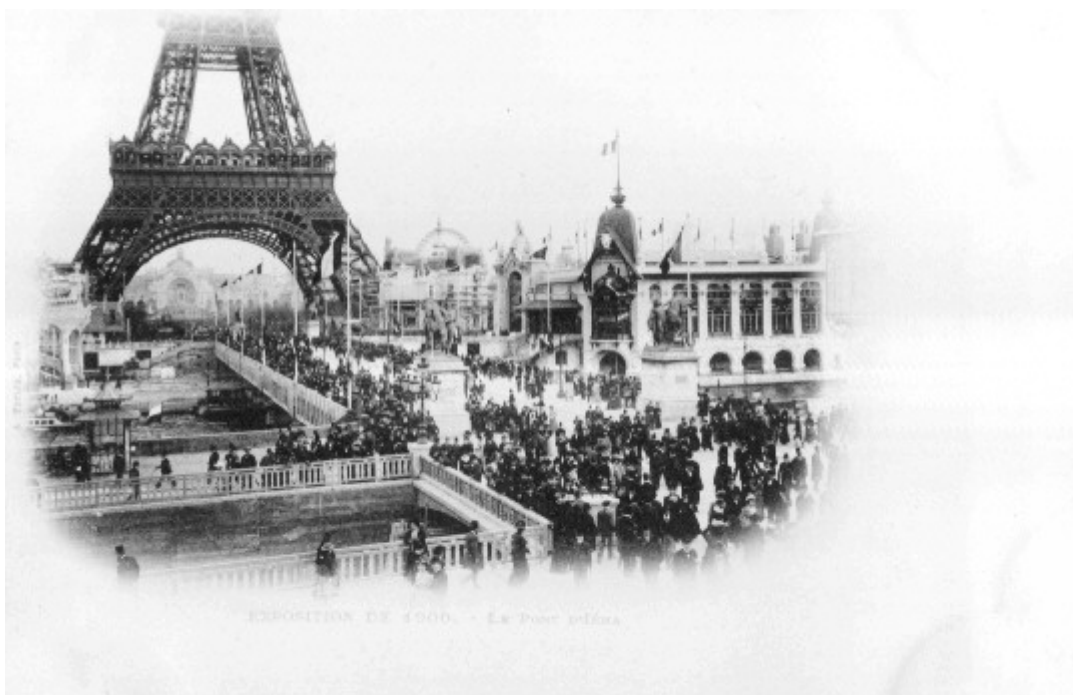
Fig.6 CP 1900, Exposition Universelle de Paris, « Le Pont de l'Alma »

« française ». On peut bien sûr aussi ajouter à la représentation des monuments, toutes les images qui donnent à voir les portraits de personnages catégorisés en tant que « types régionaux » (par exemple, le Breton ou l' Alsacien ) ou « types exotiques » (comme le « nègre d'Afrique », ou l'« indien d'Amérique »), mis en scènes de manière colonialiste 23 . Pendant au moins un siècle, la carte postale, à travers ses usages ordinaires et sa diffusion de masse à l'échelle internationale des pays industrialisés colonisateurs, renvoie à des pratiques bourgeoises de l'image. Celles-ci se déplacent, en effet, des estampes gravées, régionalistes et collectionnées, vers l'image moderne photographique et ses reproductions notamment en carte postale illustrée 24 . Aujourd'hui, dans notre monde urbanisé à l'échelle mondiale, les cartes postales sont devenues des images locales mondialisées, des images-mondes à portée de main du potentiel client de l'industrie mondiale du tourisme.