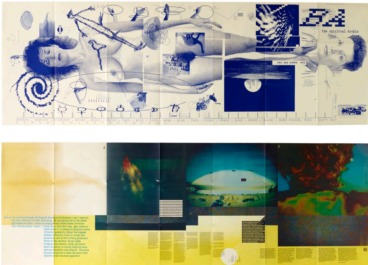
Fig. 1 April Greiman, Design Quarterly 133, Minneapolis, Walker Art Center, automne 1986. (1a. Recto / 1b. Verso).

À l'automne 1986, Design Quarterly fait paraître son numéro 133. Sous l'égide des conservateurs du Walker Art Center, situé dans la ville minière de Minneapolis, la revue consacre depuis 1946 des numéros thématiques au design, au graphisme, à l'architecture et à l'urbanisme. Praticien-nes et théoricien-nes influent-es interviennent dans ses pages et permettent de suivre l'actualité des questions technologiques, écologiques et sociales liées à ces domaines 10 . La mise en page de la revue s'adapte aux besoins iconographiques et éditoriaux de chaque numéro, aussi bien pour la couverture que pour les pages intérieures 11 , accueillant occasionnellement des expérimentations graphiques plus poussées (le numéro 130 au début de l'année 1986, avait par exemple été confié à deux professeurs de l'école de Bâle : Wolfgang Weingart et Armin Hofmann). Le numéro 133 est cependant sans équivalent. Il est l'œuvre d'April Greiman, une graphiste de 38 ans, basée à Los Angeles.