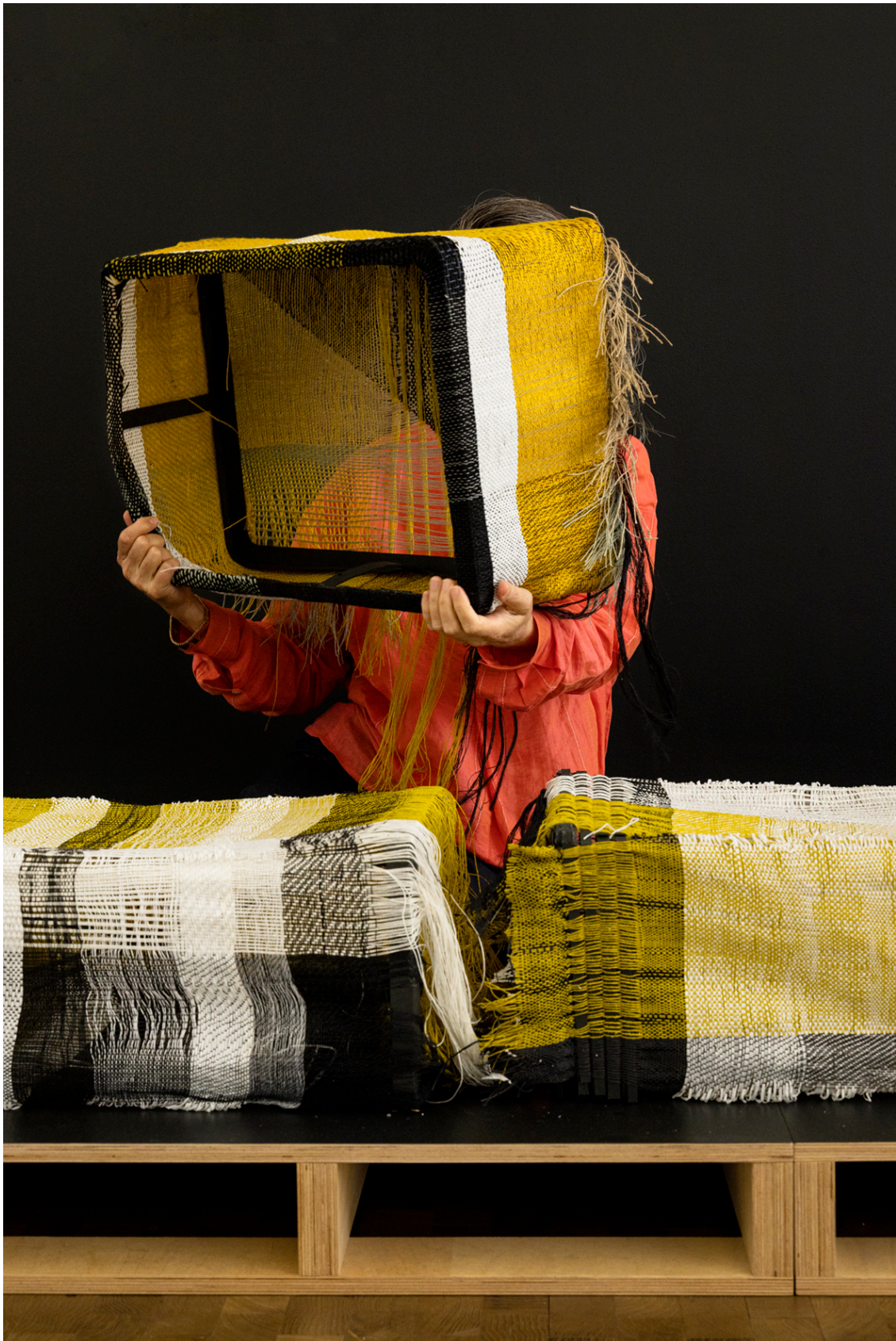
Brique tissée en 3D avec le Seamless Loom, Jongeriuslab, 2019, projet Interlace

Et enfin synthétisant l'ensemble des recherches :