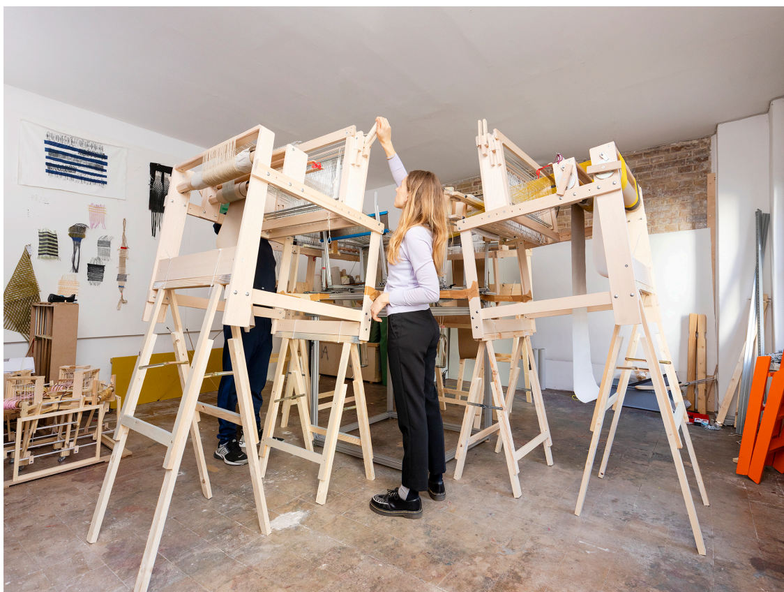
Dispositif de tissage 3 D du Seamless Loom, Jongeriuslab, 2019, projet Interlace

— Le Seamless Loom « a été conçu au Jongeriuslab pour faire des recherches sur le tissage 3D. Il s'agit de quatre métiers à tisser coupés et assemblés pour former une nouvelle machine permettant de tisser des "briques" 3D sans couture 27 ». Issu de l'assemblage de quatre demi-métiers à tisser, le Seamless loom a été conçu et fabriqué au sein du Jongeriuslab à partir d'une recherche expérimentale autour de la technique du tissage 3D. Ce dispositif a d'abord été un bricolage mis au point au fil des expérimentations pour parvenir à un dispositif opérationnel, mais encore lent. Il nécessite encore des améliorations et reste un projet en chantier.