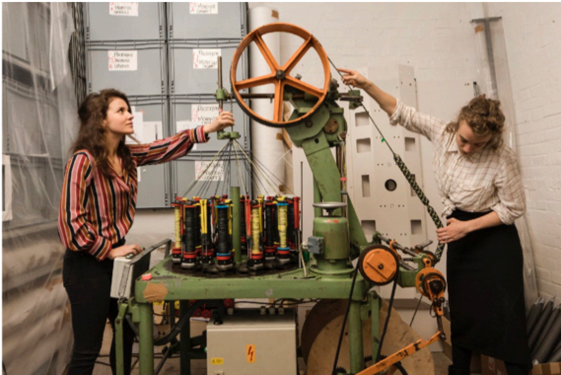
Machine à corder modifiée, Jongeriuslab, 2019, projet Interlace