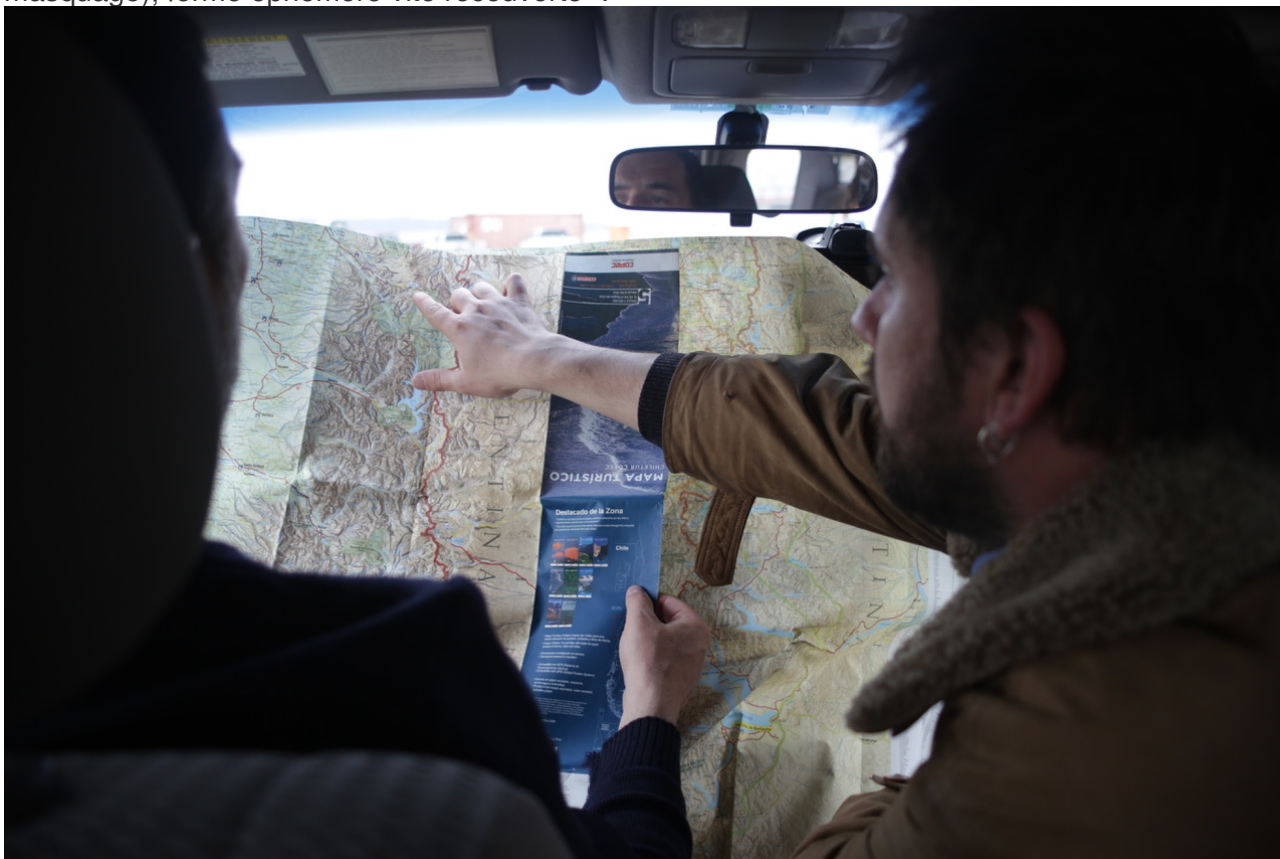
Le Toyota, sur la route, Chili, avril 2019