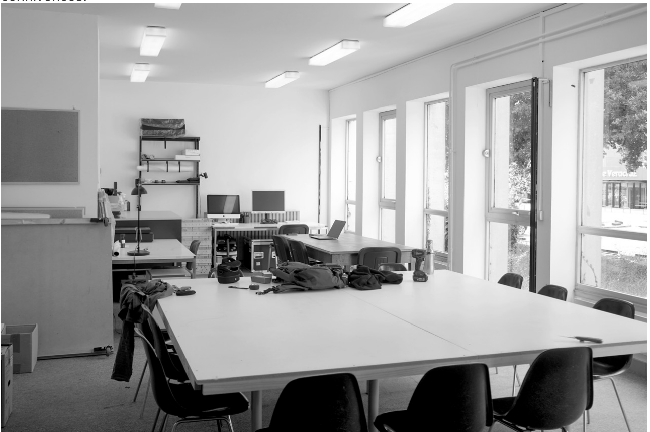
Le petit labo à la Maison des Sciences de l'Homme et d'Aquitaine (MSHA), Université Bordeaux Montaigne, Pessac, juin 2021.

Il va de soi enfin, que si l'univers universitaire est un formidable outil qui permet de développer librement ses idées (quoi qu'on en dise c'est tout de même son trait principal), il est aussi, si je puis dire, « aqueux », hostile. Il entretient les rapports de pouvoir par la fragmentation, les clivages et les rivalités. La raison économique épuise les considérations bienveillantes 51 . À l'image de Virginia Woolf qui prônait, contre l'emprise masculine, d'avoir « une chambre à soi 52 », le fait d'avoir dans l'enceinte de l'université un « espace à soi » permet non seulement de préserver son espace de pensée, plus encore d'y accueillir librement une communauté avec qui partager ses connivences.