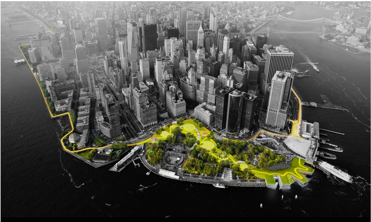
Figure 5. The Dry Line New York, 11/2017, Crédits GEO / AFP / Rebuild By Design.

Comme beaucoup d'autres villes côtières dans le monde, la ville de New York est confrontée à un risque élevé d'inondations, en particulier lors de phénomènes météorologiques extrêmes, comme l'ont montré les ouragans Irene en 2011 et Sandy en 2012. Comme il est prévu que ces événements continuent à se produire à l'avenir, la ville a élaboré un guide de design urbain pour la résilience climatique. Il traite des risques d'inondation croissants dans la ville de New York et améliore sa durabilité face à l'élévation du niveau de la mer, aux précipitations extrêmes et à la chaleur extrême 32 .