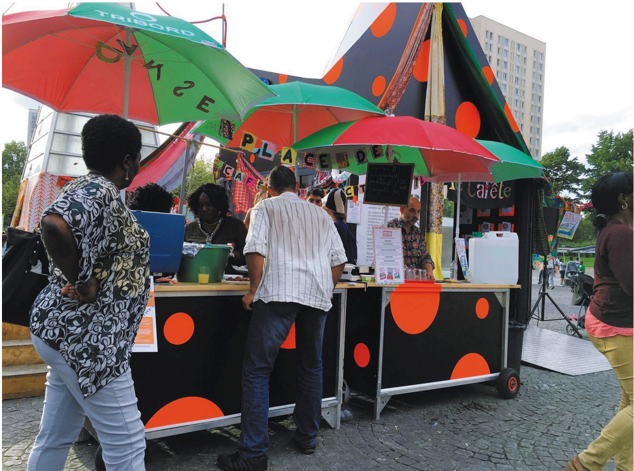
Figure 4. Cuisine mobile co-construite avec les habitants devant le CAPLA pour l'association Les Mères en place, Paris, 2016.

Dans cet exemple, la participation ne semble pas être une fin, mais un moyen de chercher des formes complexes par ajouts successifs de couches à la forme initiale. Les habitants fabriquant eux-mêmes le CAPLA, la dynamique participative est première : avant de participer au projet, ils participent à la construction du cadre dans lequel il se déroulera. La programmation et ses formes se définissent au fur et à mesure, il ne semble pas y avoir d'attendus pré-supposés de la part des designers. C'est un lieu ouvert, une recherche en soi, qui permet d'accueillir contradictions, maladresses, superpositions, piratages ou contre-sens. En « réajustant » deux fois la commande, les designers interrogent, par exemple, l'objet même du financement obtenu pour l'adapter aux usages préexistants et à venir de la place publique.