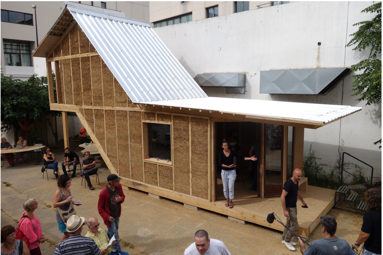
Figures 6 et 7. La cabane de chantier, lieu de monstration des méthodes et d'exposition du projet en train de se faire.