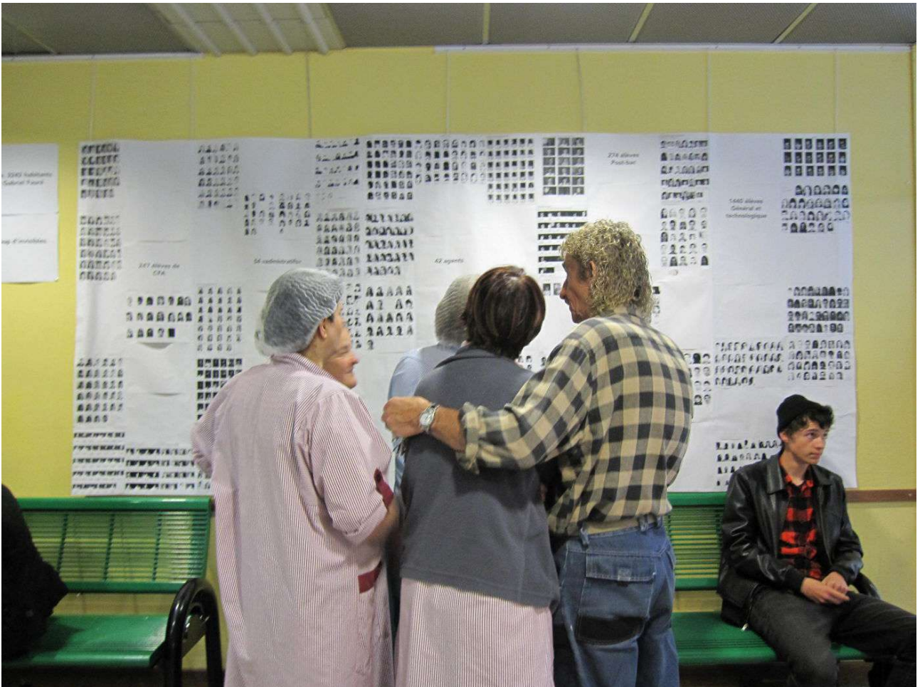
Figure 2. « Accrochage-in-progress » des usagers du projet, Annecy, 2010.