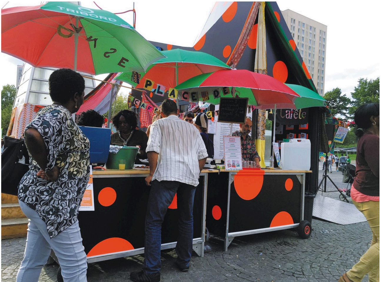
Figure 4. Cuisine mobile co-construite avec les habitants devant le CAPLA pour l'association Les Mères en place, Paris, 2016.

Dans cet exemple, la participation ne semble pas être une fin, mais un moyen de chercher des formes complexes par ajouts successifs de couches à la forme initiale. Les habitants fabriquant eux-mêmes le CAPLA, la dynamique participative est première : avant de participer au projet, ils participent à la construction du cadre dans lequel il se déroulera. La programmation et ses formes se définissent au fur et à mesure, il ne semble pas y avoir d'attendus pré-supposés de la part des designers. C'est un lieu ouvert, une recherche en soi, qui permet d'accueillir contradictions, maladresses, superpositions, piratages ou contre-sens. En « réajustant » deux fois la commande, les designers interrogent, par exemple, l'objet même du financement obtenu pour l'adapter aux usages préexistants et à venir de la place publique.