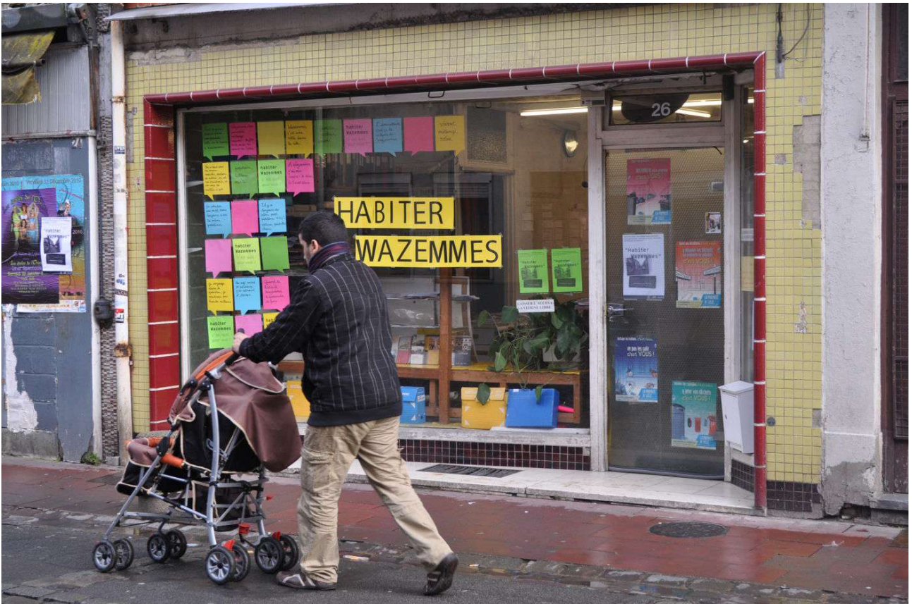
Figure 9. Vitrine de l'association de quartier exposant les pistes de projet, Lille, 2011.