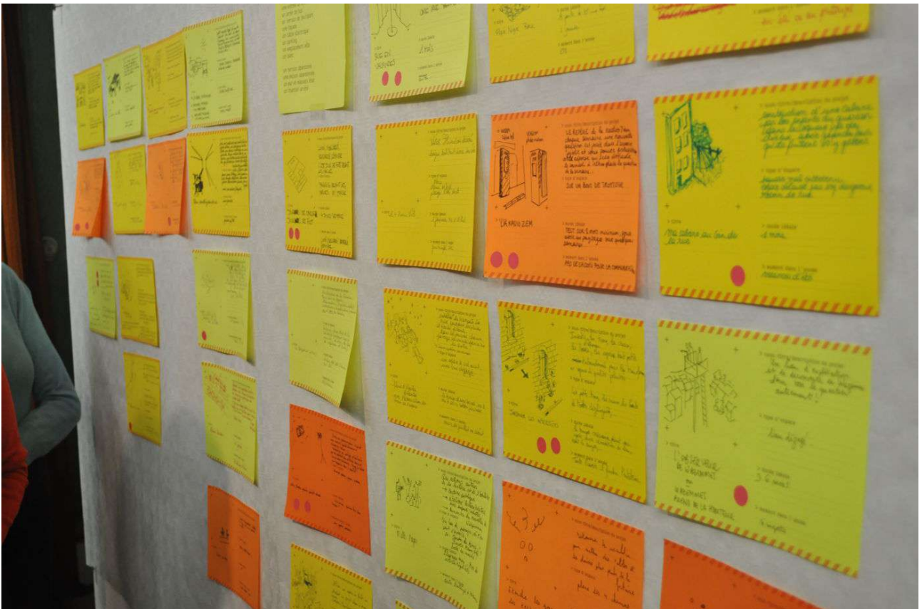
Figure 10. Exposition des idées dans le local associatif, Lille, 2011.

Il apparaît que ces expositions interrogent la capacité des individus à utiliser l'espace public comme espaces de revendication d'idéaux. Lieu de rencontres et de convivialité entre les individus, l'exposition devient le lieu de confrontation d'altérités. De fait, ces espaces publics