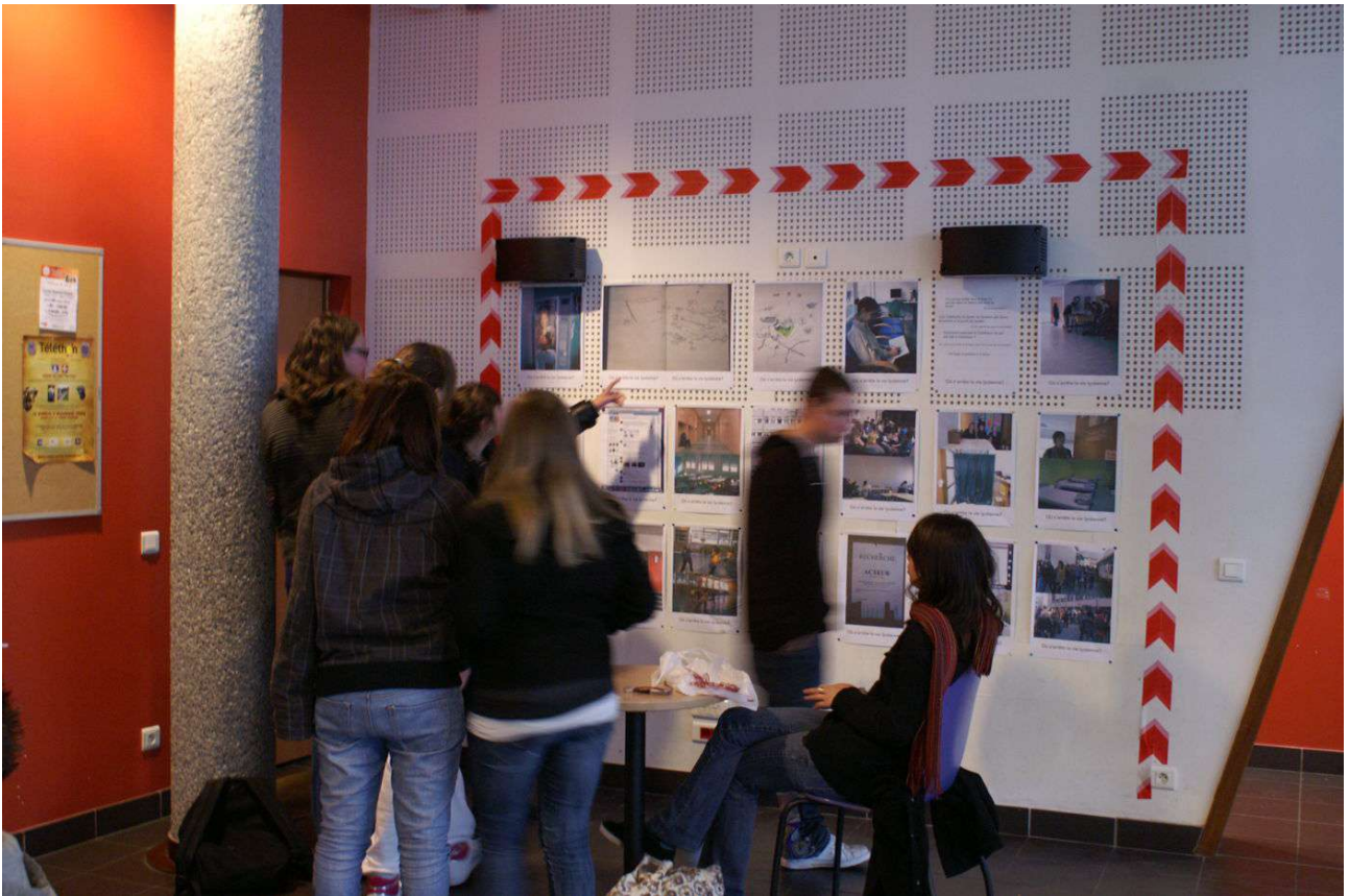
Figure 1. « Accrochage-in-progress » pour présenter les pistes de projets, Annecy, 2010.