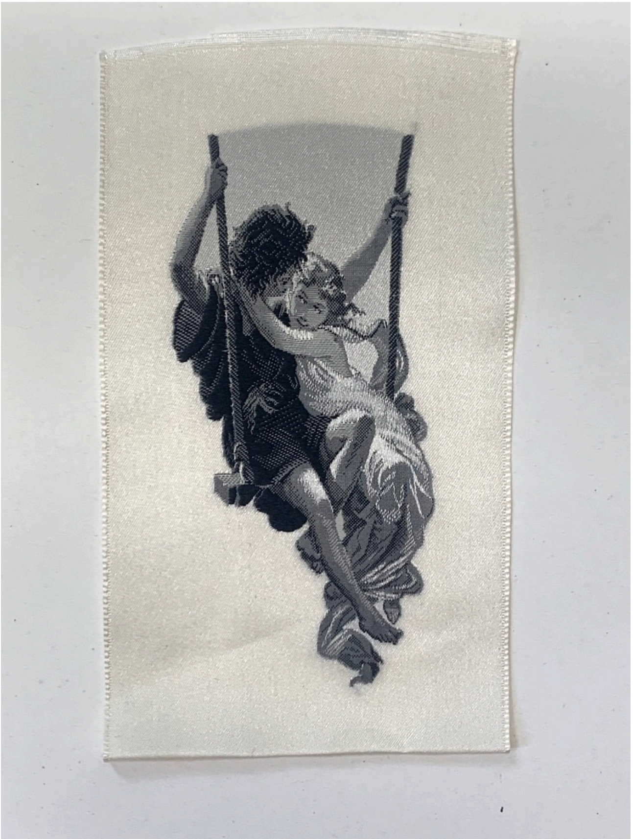
Figure 3. Image tissée reprenant un motif du Printemps , de Pierre-Auguste Cot, probablement fabriquée par Neyret Frères, 13cm x 7cm.

Par ailleurs, le tableau tissé efface aussi la profondeur de construction de l'image peinte, touche sur touche. À sa place, il fait directement apparaître l'image dans la technique. C'est le croisement mécanique répétitif et programmé des fils de chaîne et de trame qui produit l'image