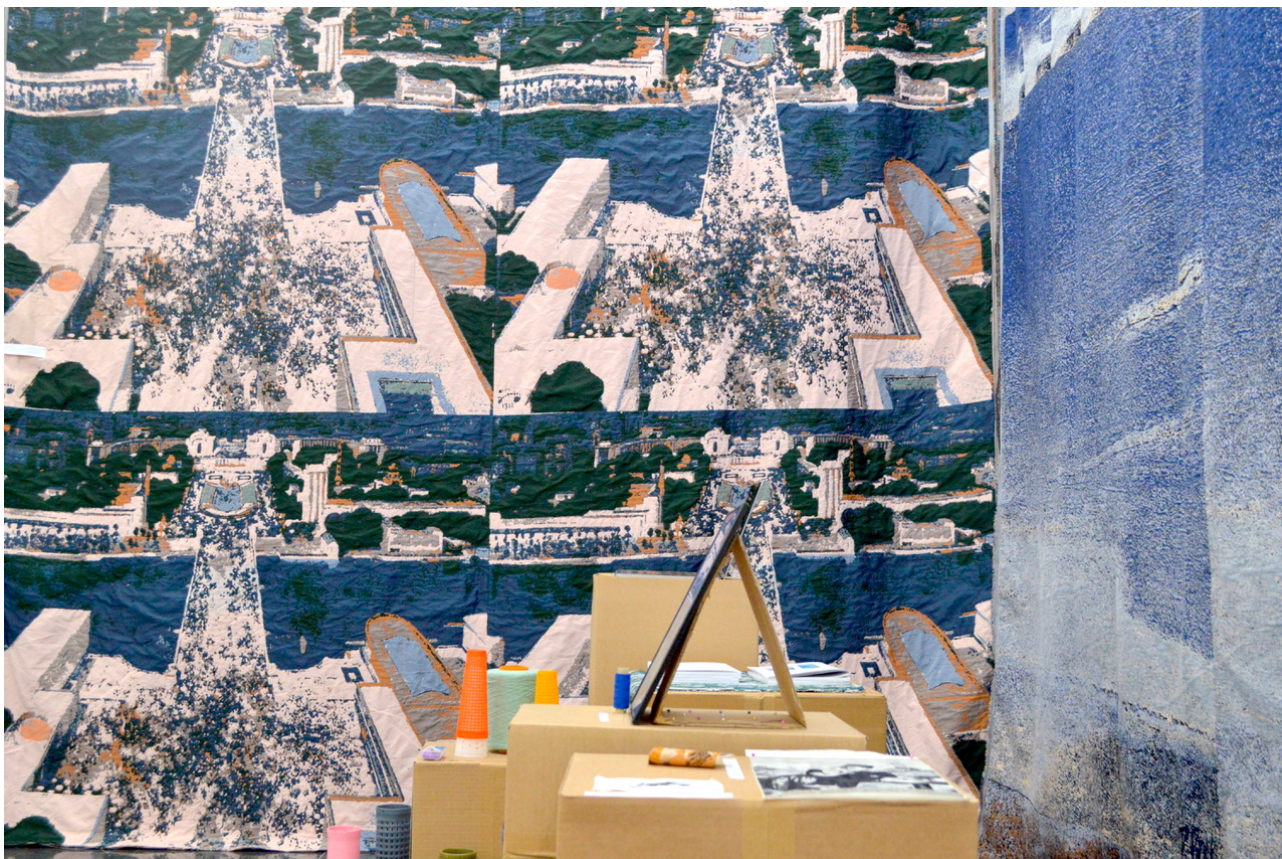
Figure 1. Reproductions tissées de La colline de Chaillot pendant l'exposition internationale de 1937, vue de la Tour Eiffel , André Devambez et d'un tableau sans titre de Pascal Bost, trois tailles, métier Jacquard à jet d'air, contexte d'ameublement, Camille Aguiraud, Léa Barelli, Linder, 2022.

de voir les reproductions tissées comme des tentatives de traduction, de la peinture au tissage. Nous proposerons de tendre vers une traduction tissée benjaminienne des tableaux, soit d'utiliser la tension du tissage Jacquard vers la peinture comme occasion de bouleverser le médium. Les essais de traduction — industrielle et personnelle — de deux tableaux, grâce à l'entreprise Linder, cise dans le département de la Loire, nous ont permis d'expérimenter de premières traductions tissées.