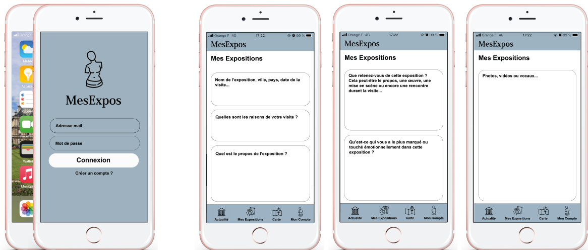
Figure 2. Interface du questionnaire, Valentine Mathieu