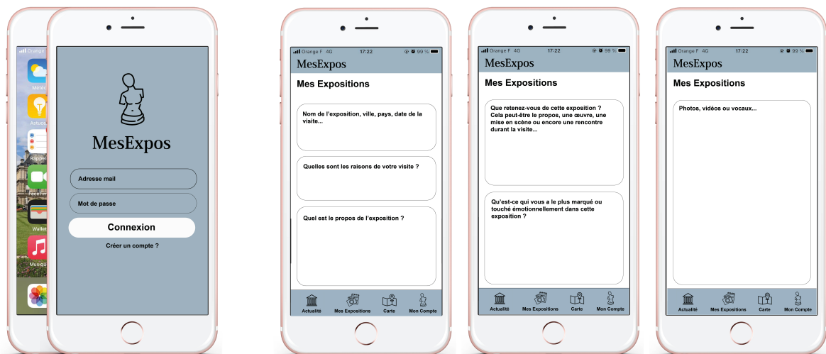
Figure 2. Interface du questionnaire, Valentine Mathieu