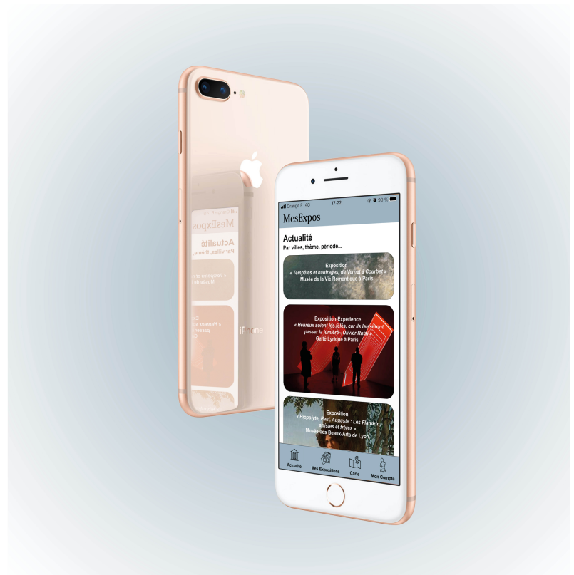
Figure 1. Présentation de l'application « MesExpos », Valentine Mathieu