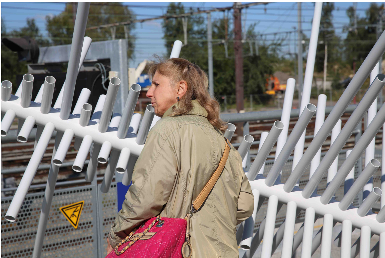
VOID Automatic Soundscape, City Sonic 2015, gare SNCB, Mons