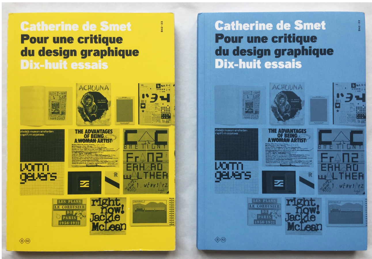
Figure 2. Vue des couvertures des deux premières éditions du livre Pour une critique du design graphique

Ce livre paru initialement en 2012, Pour une critique du design graphique 4 , a connu une nouvelle édition en 2020. Je reviendrai sur ce fait, mais vous voyez là les trois couvertures successives de ce livre.