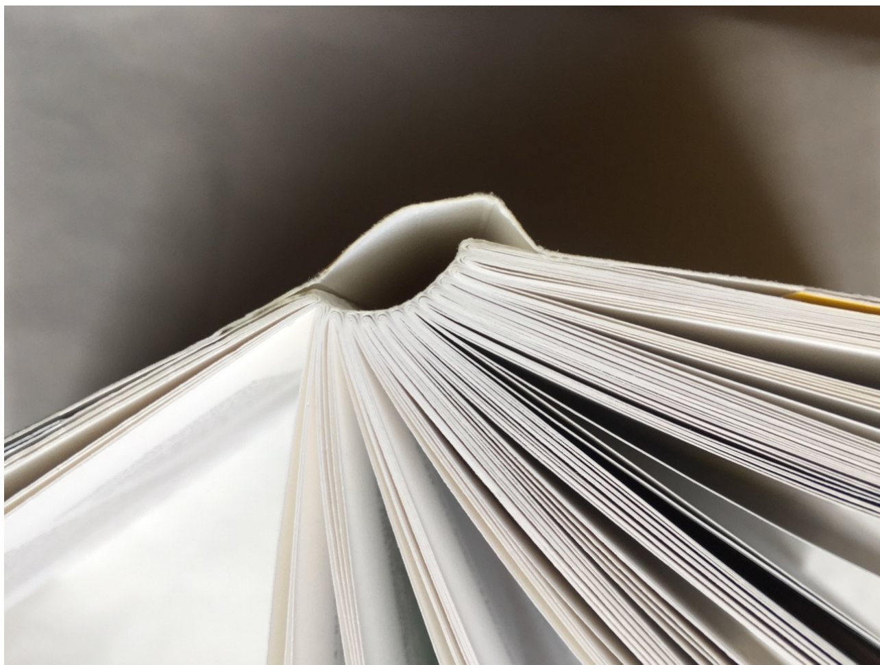
Figure 4. Vue en détail de la reliure à la colle froide des deux premières éditions du livre Pour une critique du design graphique

du volume. Je me suis rendu compte que sur les dix-huit articles, dix ou onze avaient pour sujet central des livres, ou disons des objets imprimés et reliés, et d'autres sans traiter le sujet de manière exclusive l'abordent quand même. Il y a donc seulement trois ou quatre articles qui échappent complètement à la question du codex : les trois que je viens d'évoquer et puis « Habiller le Jazz 17 » qui porte sur des pochettes d'albums. J'aimerais revenir sur la fabrique même de ce livre Pour une critique 18 . Vous avez vu tout à l'heure les couvertures illustrées des précédentes versions et j'aimerais préciser que cet éditeur B42 est un éditeur-graphiste, chose importante. Graphiste en la personne d'Alexandre Dimos qui est également cofondateur du studio de graphisme De Valence à qui est due la conception graphique du livre. Nous avons fait avec B42 et Alexandre trois autres livres ensemble 19 et la qualité de ce type de collaboration m'importe beaucoup, je trouve que c'est une garantie que le physique du livre sera sérieusement pris en compte.