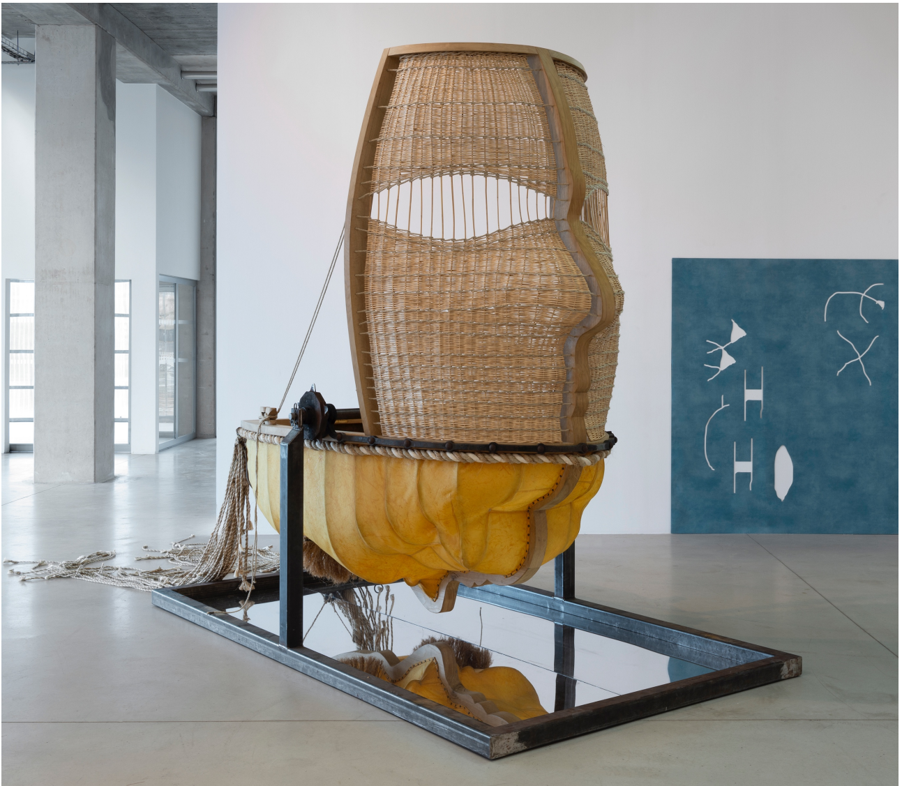
Figure 3. Vue de l'exposition « Chronique d'une collection #1 : Embarquez-vous ! », 2020, Frac Grand Large — Hauts-de-France, Dunkerque. Au premier plan : ÅBÅKE, A fleet of Mountain (Faceboat), 2017. Au second plan : Chloé Quenum, Names, 2016.