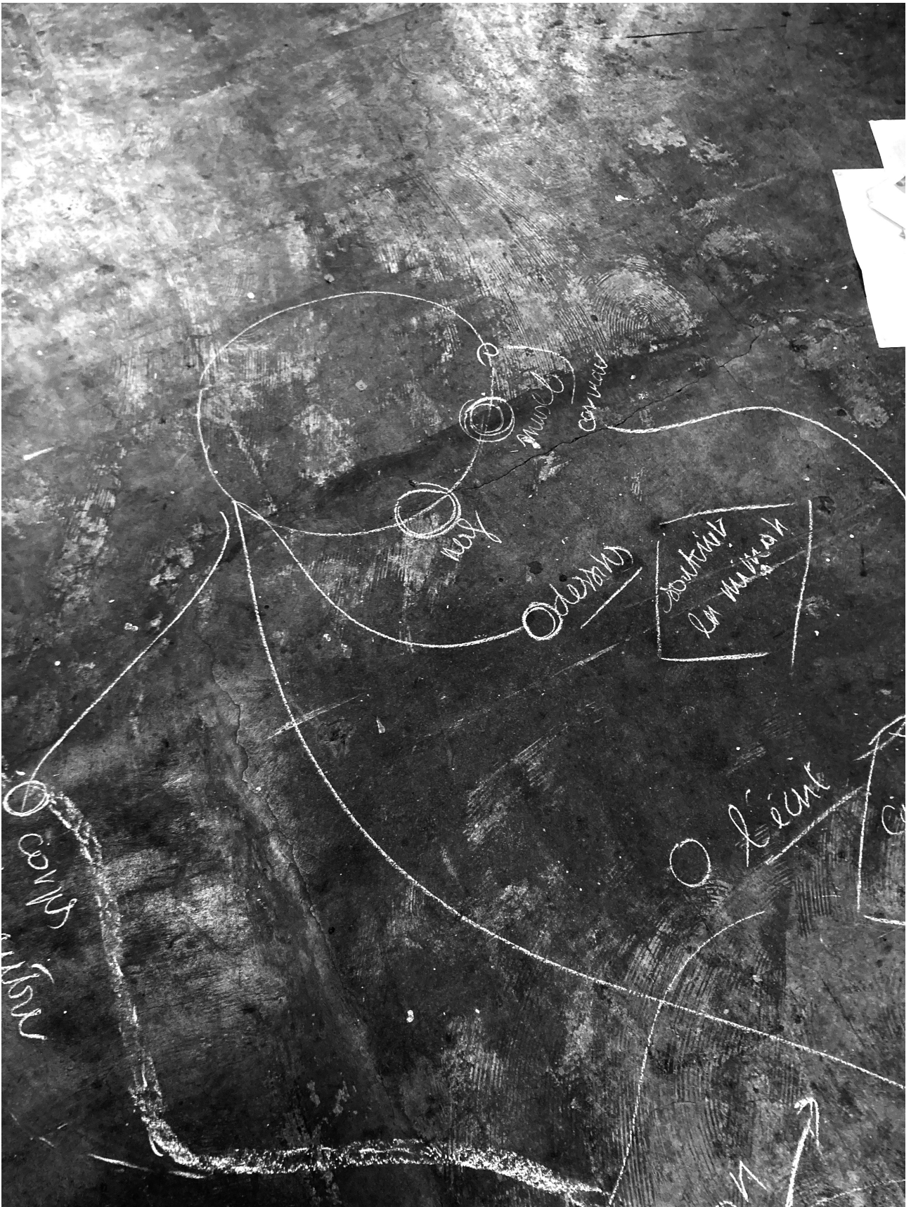
Fig.3. Cartographie des acteurs et actants documentaires décrite en temps réel par une résidente des Chaudronneries et tracée autour d'elle, à même le sol, par mes soins.